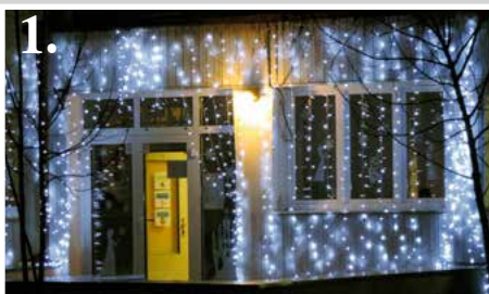
1. Materská škola Rusovce - NADEŽDA ONDEJKOVÁ