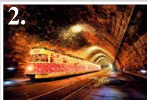
2. Vianočná električka MATEJ KOVÁČ