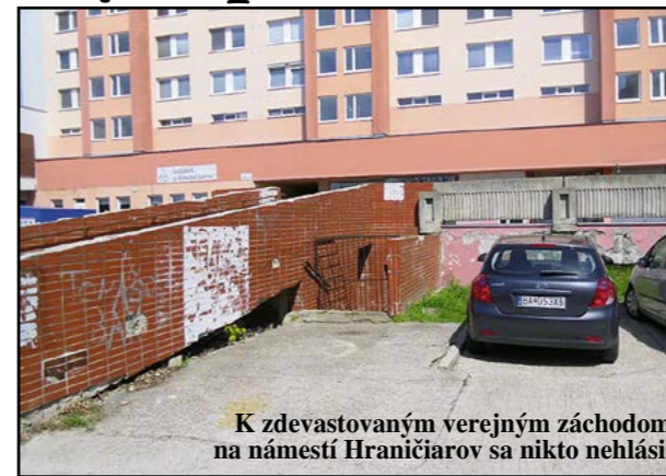
K zdevastovaným verejným záchodom na námestí Hraničiarov sa nikto nehlasí.

„Od roku 2008 sú tieto priestory opustené, chátrajú a rozpadávajú sa. Priestory slúžia ako stanovište a úkryt rôznych asociálnych osôb a narkomanov bez domova, ktorí tu všetko zničili, zdevastovali a rozkradli. Z areálu je verejné smetisko a hnojisko, medzi rôznym odpadom sa pohybujú myši, potkany, túlavé mačky a psi, ktorí sa navzájom lovia. Z týchto priestorov sa šíri nepríjemný zápach po okolí. Do týchto priestorov je vstup bezproblémový, najmä z vrchnej časti pod terasou, ktorá nie je ničím, všetky ochranné zámky boli násilím zlikvidované, alebo úmyselne poškodené. Vnútroštný pohľad je len pre silné povahy a žalúdky, lebo medzi uhy-