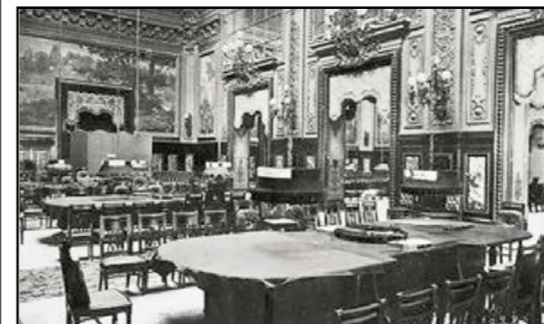
Interiér kasína z 30. rokov.min.stor.