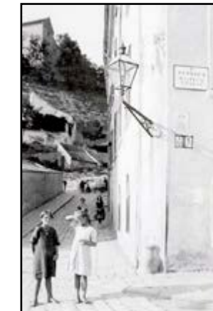
Legendárna vydrická lucerna v tridsiatych rokoch minulého storočia