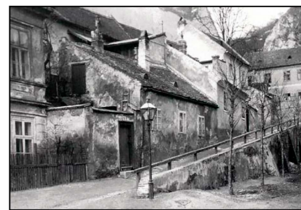
Domčeky na Vydrici mali svoje tajomstvá

E-mail: redakcia@banoviny.sk Telefón: 02/62801182 Inzercia: 0911 668 469 E-mail: reklama@banoviny.sk