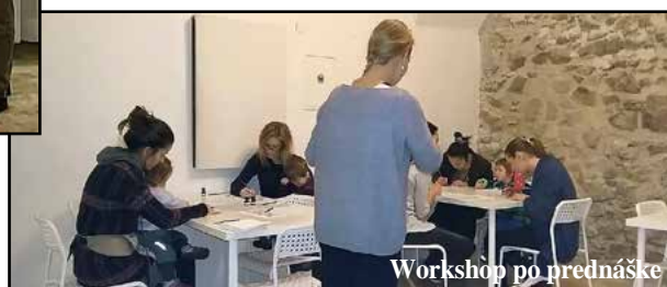
Workshop po prednáške

deti, s tým, že s rodičmi tvoria skupinové dielo a aj jazyk lektora je blízky deťom.“