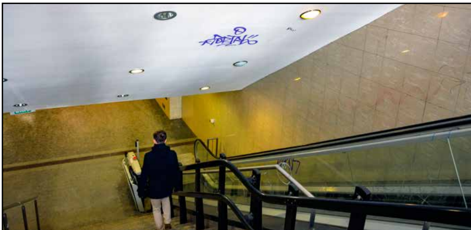
Až na zopár detailov ako sú grafity, je podchod na Hodžovom námestí v dobrom stave.

ready2run bežecká predajňa Tomášikova 5/A Bratislava 0948 679 500 po / pia 10.00 - 18.00 hod sobota 10.00 - 14.00 hod www.ready2run.sk