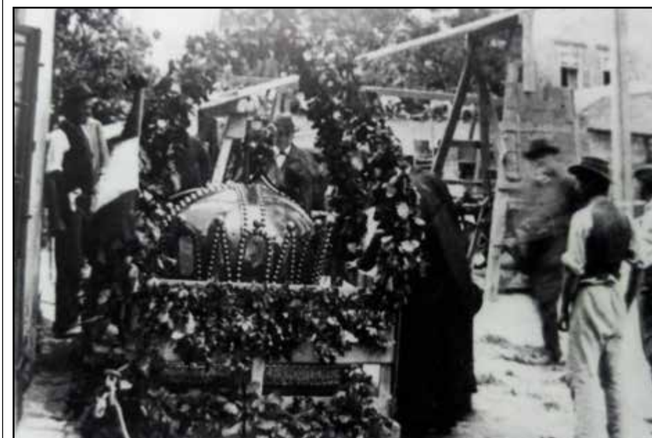
V roku 1902 na vežu Dómu osadili pozlátenú korunu.

Koruna, o ktorej sme hovorili a ktorou boli korunovaní uhorskí panovníci v dnešnej Bratislave sa nachádza v Budapešti. My môžeme akurát obdivovať jej pozlátenú maketu na veži Dómu svätého Martina. (lb)