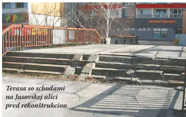
Terasa so schodami na Jasovskej ulici pred rekonštrukciou