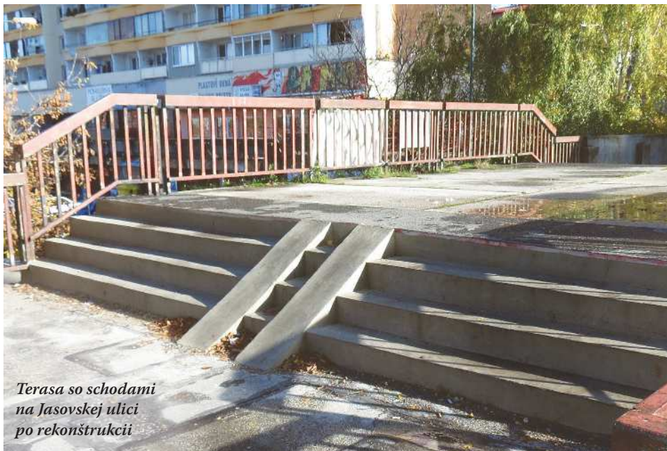
Terasa so schodami na Jasovskej ulici po rekonštrukcii