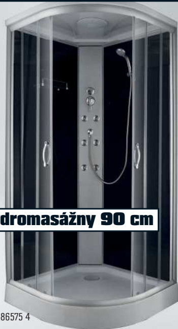
Box sprchový hydromasážny 90 cm