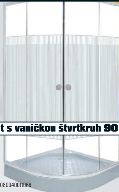
Set sprchový kút s vaničkou štvrtkruh 90 cm