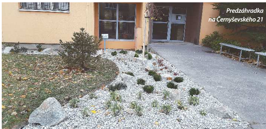
Predzáhradka na Čerňyševského 21

Michaela Platznerová