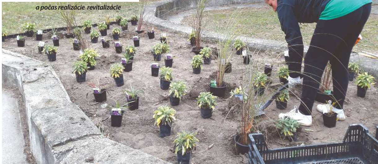
a počas realizácie revitalizácie