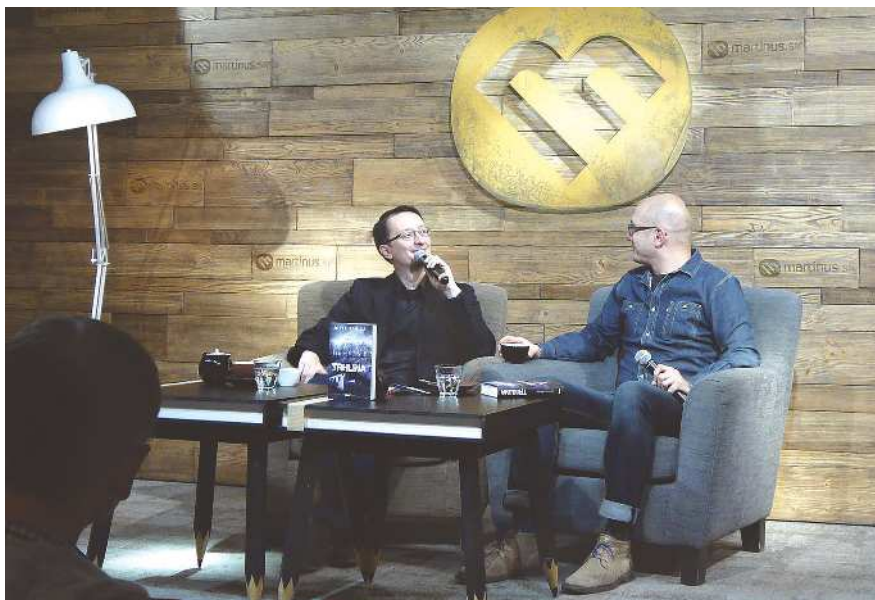
Vlavo Jozef Karika pri besede o novom románe Trhlina