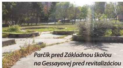
Parčík pred Základnou školou na Gessayovej pred revitalizáciou