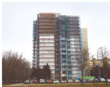
Na Beňadickej ulici