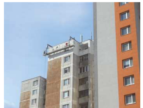
Na Budatínskej ulici