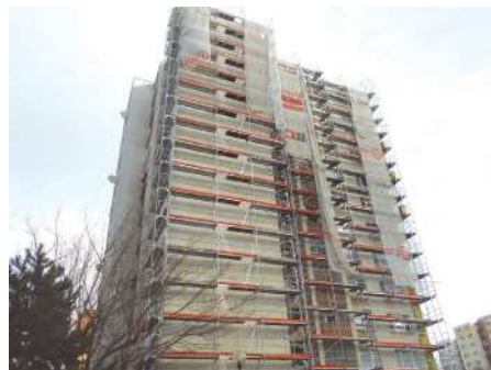
Na Hálovej ulici