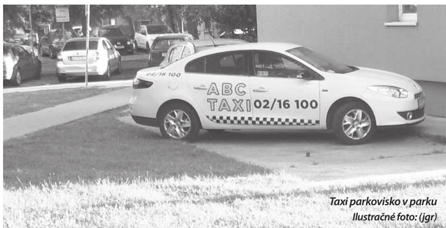
Taxi parkovisko v parku

V bratislavskom kraji za prvý mesiac roka 2017 zaznamenali policajné štatistiky 24 prípadov trestného činu Ublíženie na zdraví (SR 217), na základe ktorých bolo vyšetrovaných osem osôb (objasnenosť 43%), jedna osoba spáchala čin pod vplyvom alkoholu. Tak vraví § 156 trestného zákona v súvislosti s ublížením na zdraví: Kto inému úmyselne ublíži na zdraví, potrestá sa odňatím slobody na šesť mesiacov až dva roky. (Okolnosťou podmieňujúcou použitie vyššieho trestnej sadzby - odňatie slobody na jeden rok až päť rokov - je čin spáchaný na chránenej osobe, z osobitného motívu, závažnejší spôsob konania, za krízovej situácie alebo spôsobenie ťažkej ujmy na zdraví).