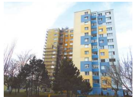
Na Smolenickej ulici