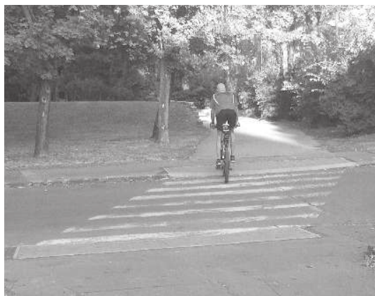
Nateraz sa nič nestalo. Tak, čo?

Apropo, z malého zamyslenia o spoluobčanoch na bajkoch takmer vypadlo jedno želanie - nech si len vypijú, potrundžený cyklista predsa nepredstavuje žiadne riziko. Vzďajme hold múdrym poslancom (sic) a alkoholu, určite prispejú k zvýšenej bezpečnosti na našich cestách. Azda sa raz dočkajú aj motoristi. To len bude kucapaca!