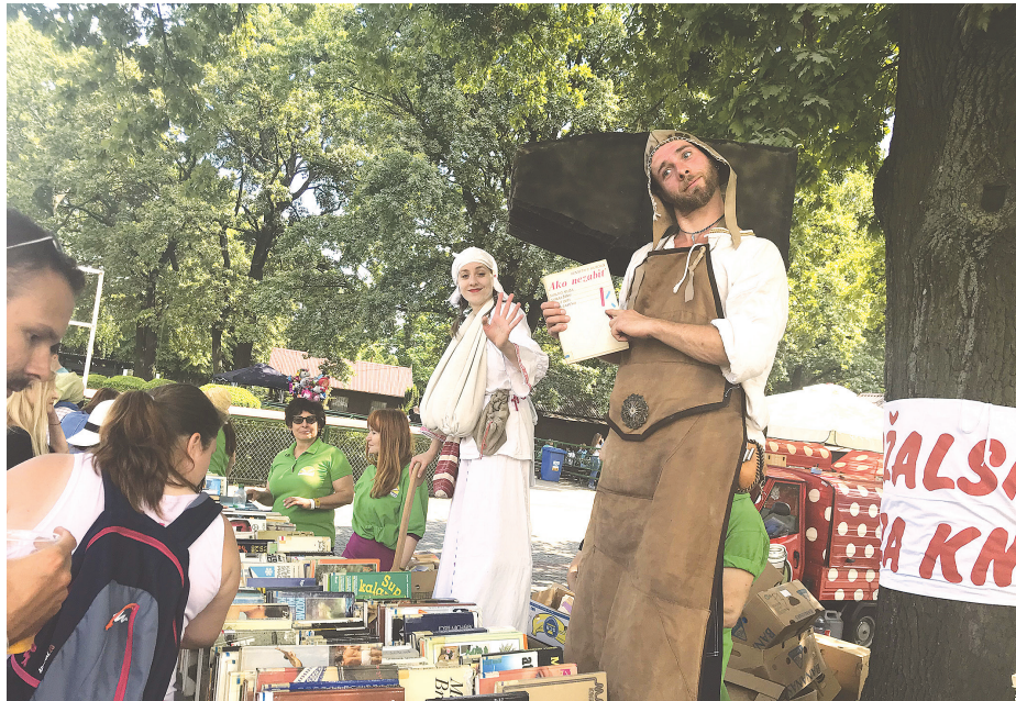
Burza kníh Miestnej knižnice Petržalka