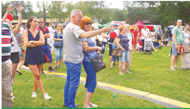
Dobrá zábavu treba zdokumentovať