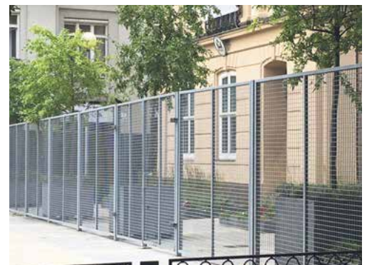
Plot špatí Hviezdoslavovo námestie už viac ako desať rokov

poslanec mesta za mestskú časť Staré Mesto martin@borgula.sk, 0905 803 527