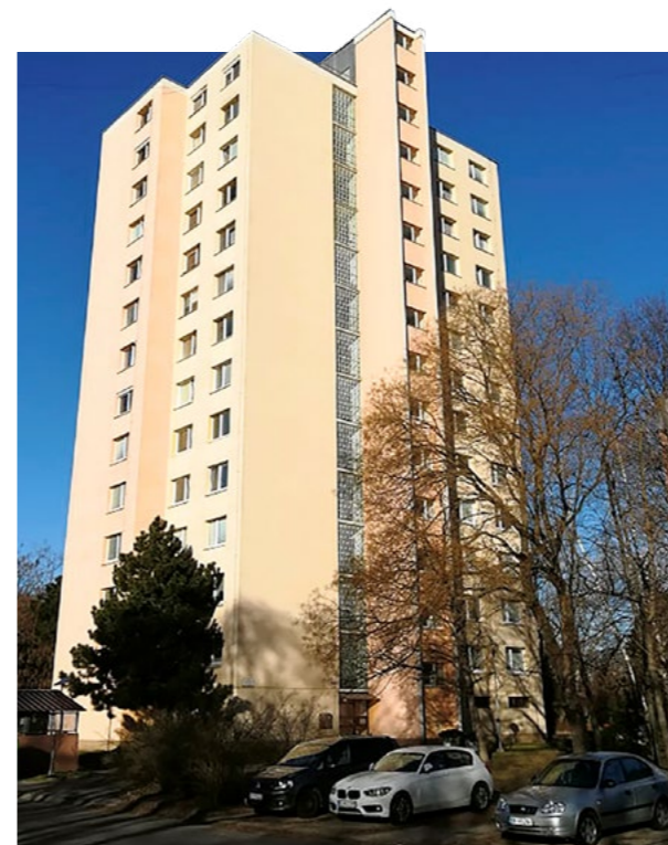
▲ Možná obnova paneláku a revitalizácia okolitého verejného priestoru na Jankolovej 2.