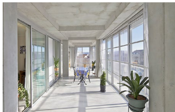
▲ Byty v panelákoch získali priestor pre zimnú záhradu.

Je dobré vedieť, že sa netreba obmedziť len na zateplenie fasády. Prvou lastovičkou v Petržalke sú „domontované“ lodžie na Lachovej ulici. Možností, ako zvýšiť komfort bývania aj verejného priestoru je však viac.