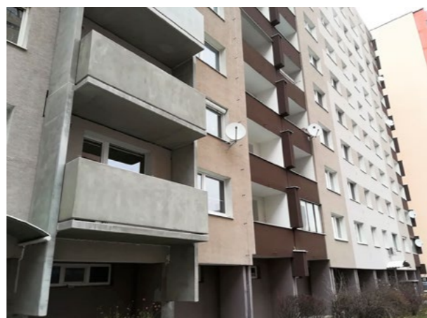
▲ Prvou lastovičkou, ktorá v Petržalke zvestuje, že transformácia domov je rovnako dôležitá ako nová výstavba, sú „domontované“ lodžie na Lachovej ulici.