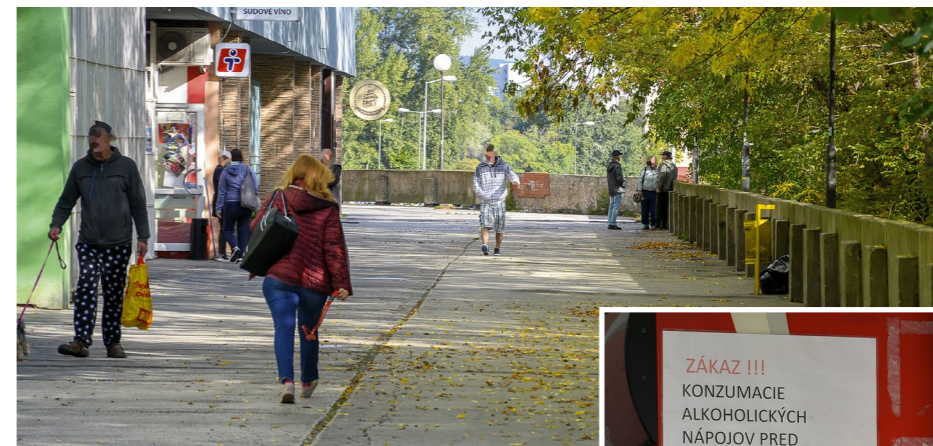
Terasy na Beňadickej ulici. Jej bežnou súčasťou sú už roky skupinky popijajúcich. Trafika sa ich snaží vyhnať pred svojich dverí aj týmto nápisom.

Napokon na konci terasy, keď prejdeme okolo Domu kultúry Lúky a kedysi legendárneho Braníka na Víglašských, je predajňa potravín otvorená tiež od 7h do 21h. Tu umelohmotné poldecáky