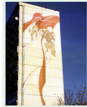
▲ Malba na Jasovskej ulici od Ivana Schurmannu bola zničená ako prvá.