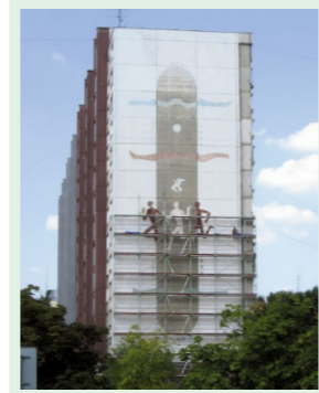
▲ Bežci od Ota Luptáka na Romanovej ulici, zateplené 2012.