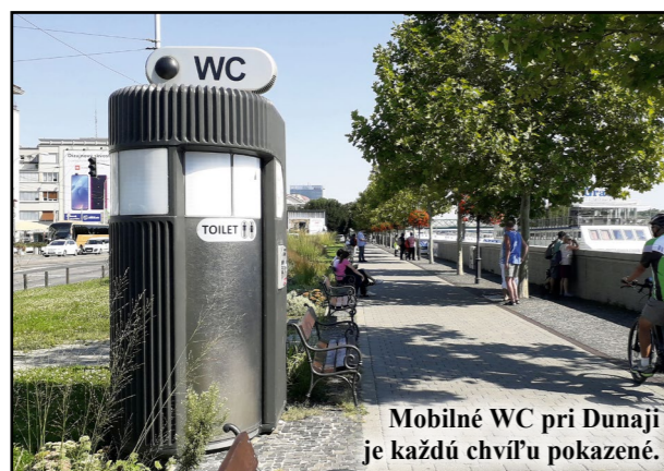
Mobilné WC pri Dunaji je každú chvíľu pokazené.

Keď im ľudia nahlásia poruchu, vzápätí vraj upozornia firmu, aby WC čo najskôr sfunkčnila.