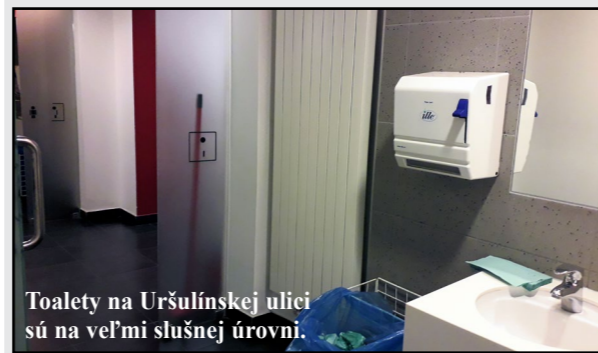
Toalety na Uršulínskej ulici sú na veľmi slušnej úrovni.

Hoci sú na veľmi slušnej úrovni, domáci ich vraj veľmi nevyužívajú. „Chodia k nám najmä turisti, no aj tých je z roka na rok menej,“ konštatuje pani toaletárka.