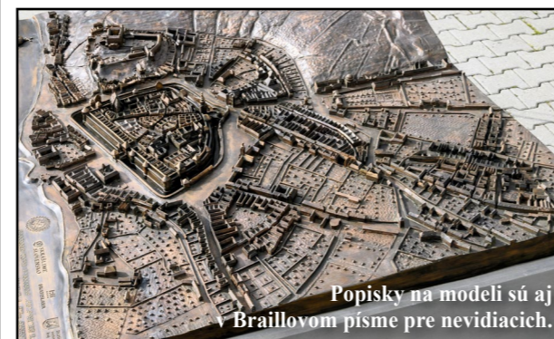
Popisky na modeli sú aj v Braillovom písme pre nevidiacich.