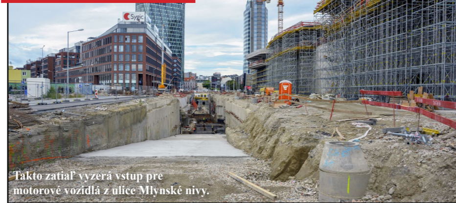
Takto zatiaľ vyzerá vstup pre motorové vozidlá z ulice Mlynské nivy.