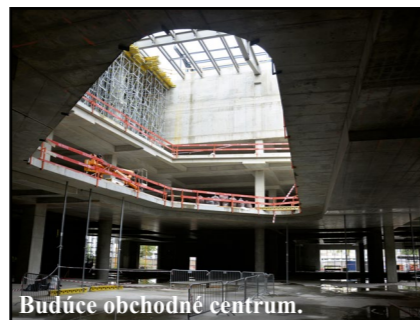
Budúce obchodné centrum.