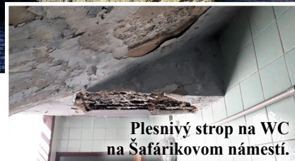
Plesnivý strop na WC na Šafárikovom námestí.