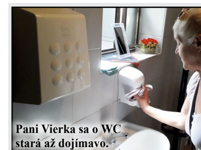
Pani Vierka sa o WC stará až dojemne.