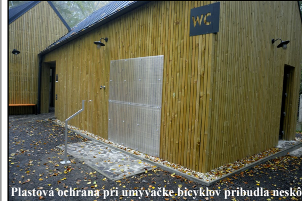
Plastová ochrana pri umývačke bicyklov pribudla neskôr.