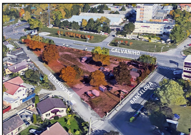
V tejto lokalite, vymedzenej ulicami Galvaniho, Banšellova a Terchovská, má byť nájomný bytový dom.

„Chceme kvalitný verejný priestor, riešenia rešpektujúce ochranu životného prostredia, pričom minimálne štvrtina pozemku musí byť zelená, zatravnená plocha. Taktiež od súťažných návrhov očakávame, že navrhnú do exteriéru rôzne herné prvky pre všetky vekové skupiny – deti, dospelých, seniorov. Veríme, že v tomto smere zapracujú aktuálne trendy a najlepšie možné riešenia. V súťaži tiež požadujeme, aby 5 až 8 percent z celkovej podlažnej