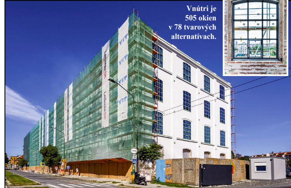
Nová fasáda budovy Pradiarne pripomína pôvodný vzhľad z rokov 1900 – 1920.

Pradiareň 1900 sa po obnove a premene stane dominantou novej štvrte, ktorá priniesie do lokality nové funkcie – občiansku vybavenosť v podobe obchodných prevádzok na prizemí, jedinečné kancelárie, ako aj kultúrno-spoločenský priestor s auditoriom v priestoroch niekdajšej Silocentrály.