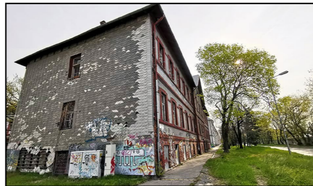
V budove na Rendezi v Rači budú ďalšie nájomné byty.

Zabudnuté nehnuteľnosti Ďalšie nájomné byty pribudnú po plánovanej obnove nevyužívaných budov, ktoré sú vo vlastníctve mesta. Rozpracované sú už objekty v niekoľkých lokalitách, medzi ktorými sú ulice Ventúrska, Pri Habánskom mlyne či Zámokské schody, kde má byť