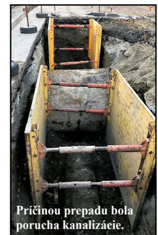
Príčinou prepady bola porucha kanalizácie.