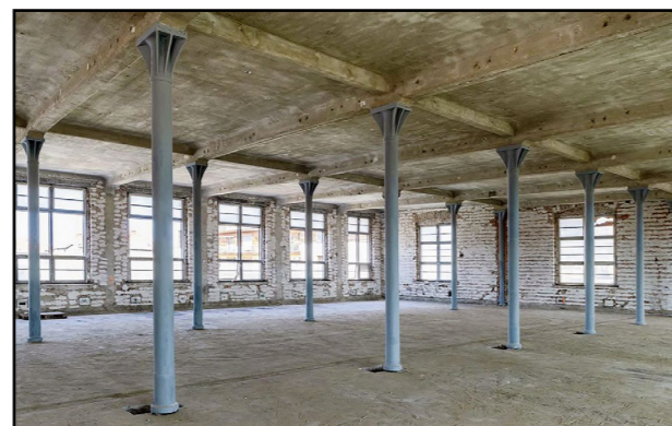
Rekonštruujú sa všetkých 403 liatinových stĺpov a 1 betónový stĺp.