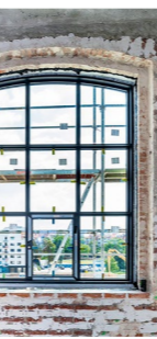
Vnútri je 505 okien v 78 tvarových alternatívach.

Pradiareň prešla v minulosti viacerými prestavbami, pre ktoré postupne stratila svoj charakter. Výrazná rekonštrukcia sa uskutočnila v 60. rokoch – vtedy boli na hlavnej budove odstránené veľké kovové okná s oblúkmi a nahradené drevenými oknami s rovným prekladom. „Pôvodné okná boli ponechané iba na výtahových a schodiskových vežiach a práve tie budú v rámci obnovy zrepasované a osadené na pôvodné miesto,“ opisuje architekt Masár detaily obnovy. Zrepasujú a znovu osadia 80 pôvodných okien. Aby sa dosiahla energetická efektívnosť, po dohode s pamiatkarmi zvyšok okien nahradia nové hliníkové s oblúkom, ktoré kopírujú dizajn z roku 1900, ale zároveň majú vlastnosti súčasných kvalitných okien, ktoré zabezpečia tepelnú pohodu v interiere. Hlavnú nosnú konštrukciu Pradiarne tvorí 403 liatinových stĺpov (plus 1 betónový) vyrobených v budapeštianskej zlievari. Je to konštrukcia, akú nájdete iba v budovách z obdobia secesie. Historická nádrž na streche budovy bude po rekonštrukcii slúžiť ako výstavný exponát. Druhá nádrž, situovaná v objektu, bude obnovená a s použitím moderných technológií bude slúžiť svojmu pôvodnému účelu. (nc)