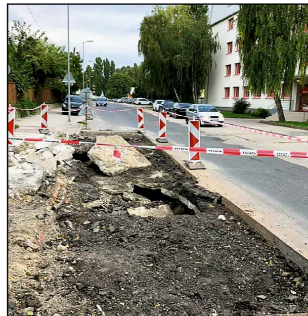
Cesta sa prepadla pri oprave „bežného výtlku“.

Viac na www.banoviny.sk