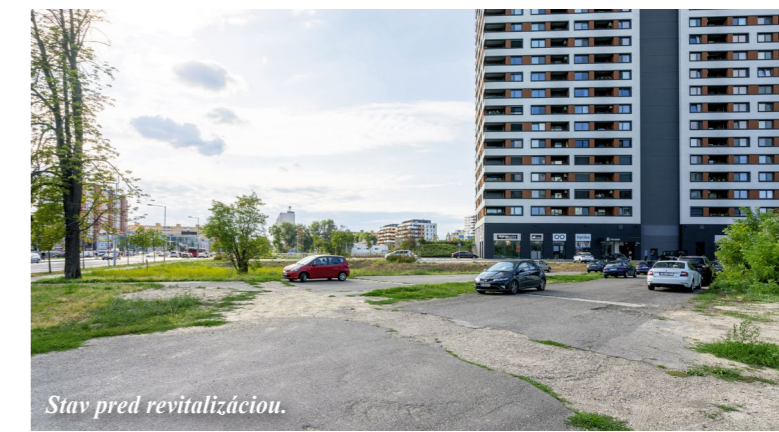
Stav pred revitalizáciou.