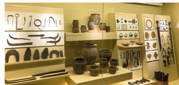
▲ Nálezy z Nitrianskeho kniežatstva vystavené na Bratislavskom hrade