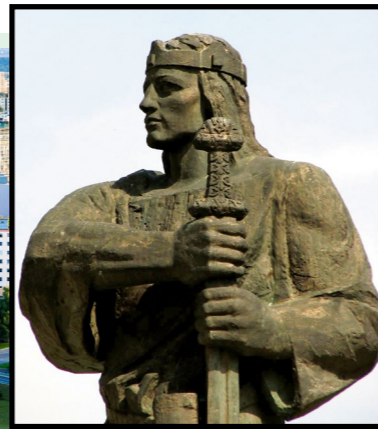
▲ Knieža Pribina

Po týchto udalostiach sa, v roku 833, dal pokrstiť aj pohan Pribina. Po niekoľko-ročnom putovaní okolitými krajinami sa knieža Pribina so svojou družinou, a hlavne so svojou ženou a synom Koceľom, usadil v Panónii. V tejto krajine si za svoje sídlo vybral