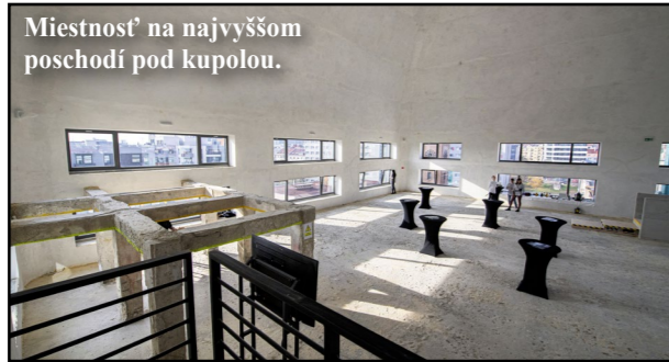
Miestnosť na najvyššom poschodí pod kupolou.