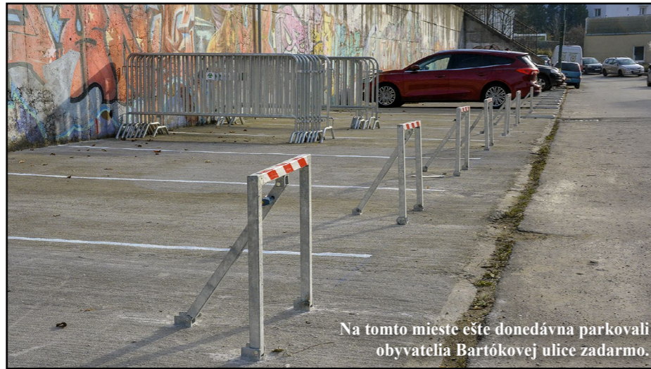
Na tomto mieste ešte donedávna parkovali obyvatelia Bartókovskej ulice zadarmo.