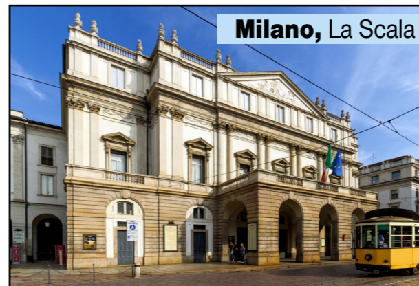
Milano, La Scala