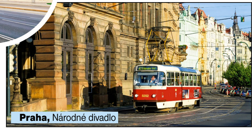
Praha, Národné divadlo