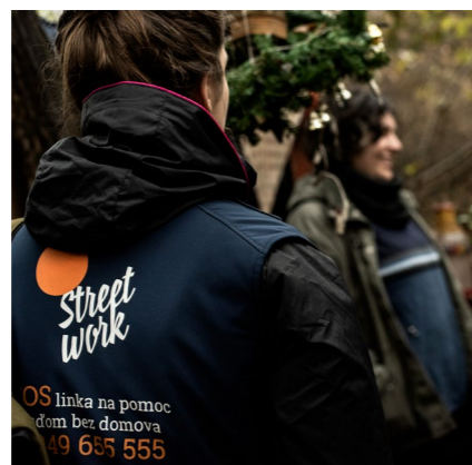
OS linka na pomoc dom bez domova 09 655 555

Ľudia bez domova sú často prehládani a odsudzovaní, ale aj oni si zaslúžia pozornosť. Systematická a kvalifikovaná práca s nimi ich môže vyvieť z bludného kruhu a zaradiť naspäť do bežného života.