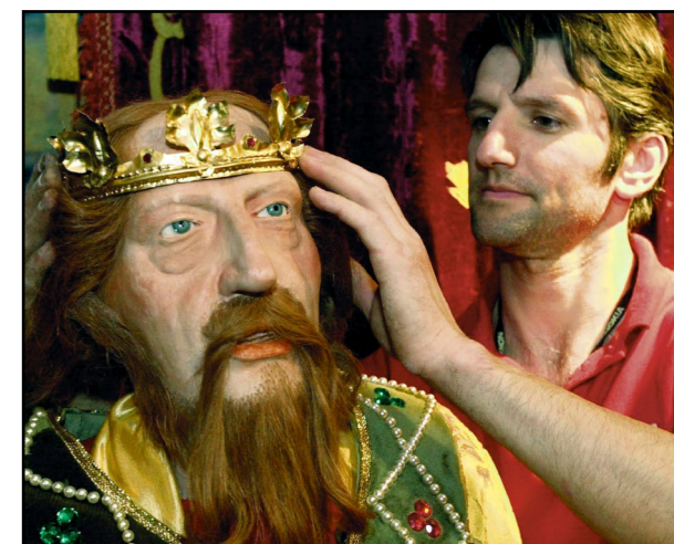
Figurína kráľa Žigmunda Luxemburského v košíckom múzeu voskových figurín.