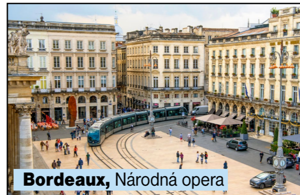
Bordeaux, Národná opera