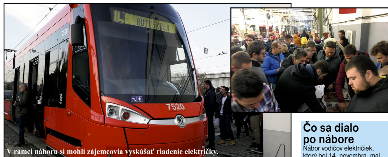
V rámci náboru si mohli zájemcovia vyskúšať riadenie električky.