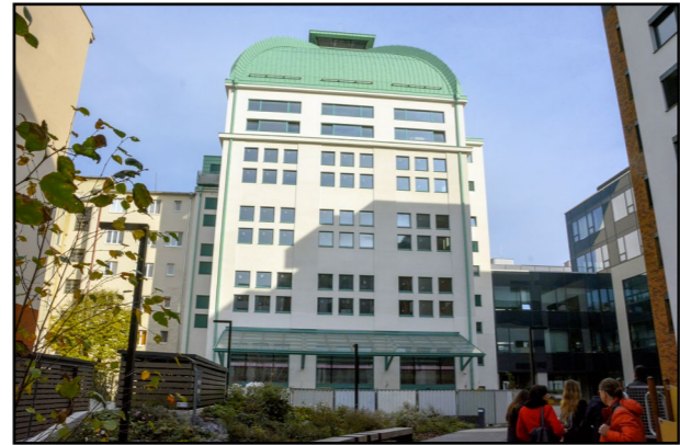
Budova spilky – kvasiarne piva na Legionárskej ulici.

Na piatich nadzemných podlažiach poskytnú bu-