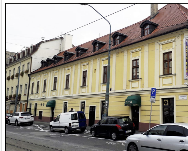
V týchto končinách neďaleko dnešnej Obchodnej ulice bol nevestinec. Či ho navštívil aj kráľ Žigmund, už nezistíme.

Zdroje: Slavomír Michálek, ed.: História zadnými dverami (HŮ SAV, 2018); Tomčík Vladimír: Rozkoš, nevera a predajná láska (Ikar, 2008)