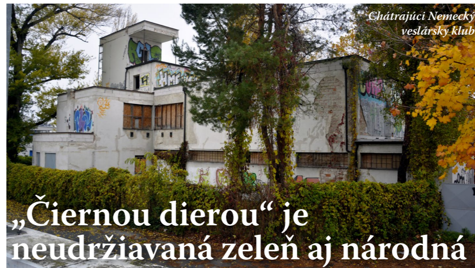
Chátrajúci Nemecký veslársky klub

lastiam, v poslednom období najviac parkovaniu, rekonštrukcii terás, škôlkam, podpore kultúry a rôznych voľnočasových aktivít, ale aj neželanej zástavbe, či tepelnej energetike. Súvisí to tiež s tým, že som členom komisie a pracovných skupín, ktoré sa tým zaoberajú. Ako mestský poslanec som napr. členom dozornej rady spoločnosti OLO, a.s., takže sa venujem aj nakladaniu s odpadmi, alebo predsedom komisie na ochranu verejného záujmu, čo je veľmi dôležité, lebo korupcia, klientelizmus a tunelovanie verejných peňazí spôsobuje nemalé škody všetkým, a tak