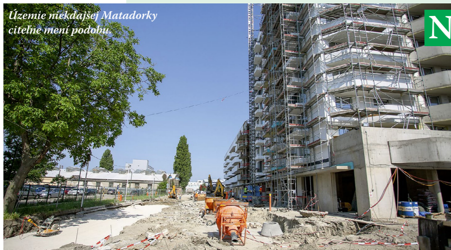
Územie nekďajšej Matadorky citelne mení podobu.