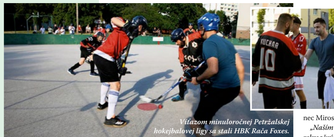
Vítazom minuloročnej Petržalskej hokejbalovej ligy sa stali HBK Rača Foxes.