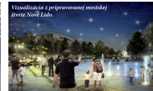
Vizualizácia z pripravovanej mestskej štvrte Nové Lido.