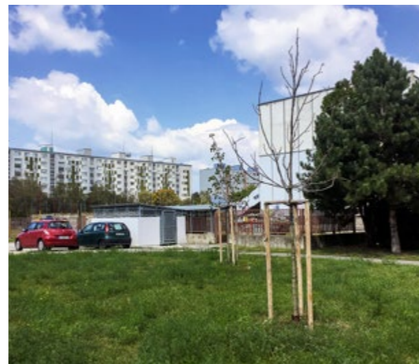
▲ Sadené na jeseň 2019 - Holíčska 48