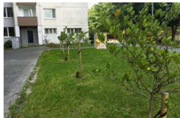
▲ Sadené na jeseň 2018 – Markova 15

Mestská časť zatiaľ nedisponuje zoznamom konkrétnych lokalít, ktorých sa bude týkať jesenná výsadba stromov. Ak máte tip, po-