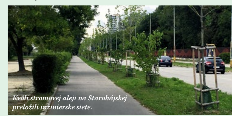
Kvôli stromovej aleji na Starohájskej preložili inžinierske siete.

Evidenciu výrubov a náhradných výsadiieb majú na základe štatútu na sta-