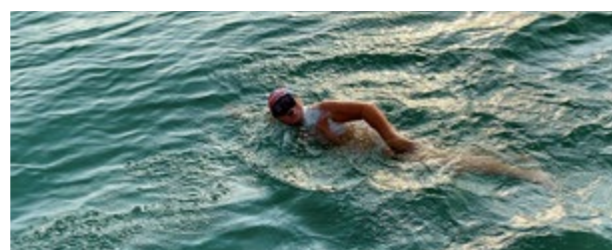
▲ Takmer celú 42-kilometrovú trasu absolvoval v tme.