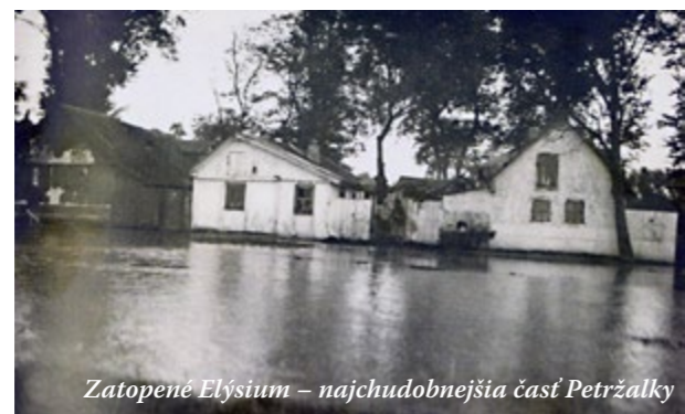
Zatopené Elýsium - najchudobnejšia časť Petržalky