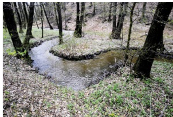
Meander horného toku Vydrice.