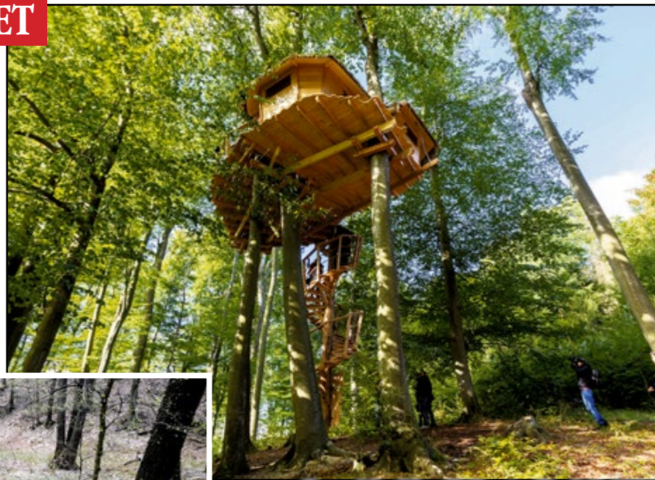
Drevený domček na Kačine otvorili v októbri 2016.

Tip na výlet ponúka na svojom webe bratislavská župa. Vydrica je jeden z mála tofikálnych situácií. Vo voľné dni je tu už príliš plno, pre peších sme preto vybudovali samostatný chodník lesom, kde nájdú pokoj,“ spresnila organizácia Mestské lesy v Bratislave. Aktuálne môžete využívať prvú polovicu trasy, ktorá už je dokončená. Do začiatku rekreačnej sezóny dokončia aj zvyšný úsek v smere na Biely kríž. Trasa bude súčasťou Štefánikovej magistrály. „Režim na asfaltovej ceste zostane rovnaký, t. j. zmiešaná cesta pre peších, cyklistov a autá údržby lesoparku,“ uviedla organizácia. (TASR)