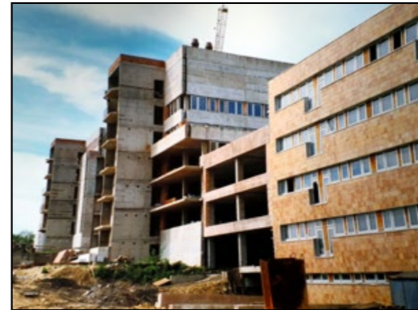
Nedostavaná nemocnica na Rázsochách, ktorú zbúrali.