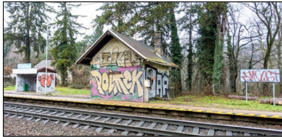
Pamiatkovo chránený strážny dom má ustúpiť novej vlakovej koľaj.