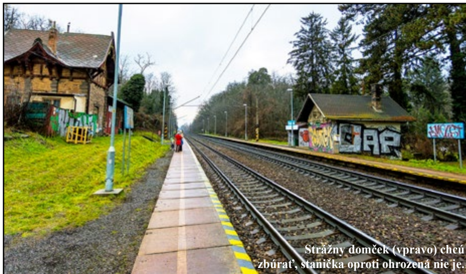
Strážny domček (vpravo) chcú zbúrať, stanička oproti ohrozená nie je.

Pripomeňte si mená legendárnych čašníkov z bratislavských kaviarní, na ktorých mnohí dodnes spomínajú.