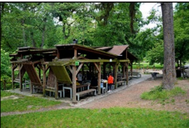
Altánky na Železnej studničke.

Dostanete sa tam aj zo Železnej studničky. Od Vojenskej nemocnice prejdete parkoviskom pod Červeným mostom a po asfaltovej ceste Hornou Mlynskou dolinou popri potoku. Minierte zrekonštruovaný mlyn Klepáč, neskôr budovu Mestských lesov Bratislava a Deviaty mlyn. Na križovatke ciest stáli pôvodné liečebné kúpele, odbočíte doľava a začnete po ceste stúpať smerom na Kačín. Pozdĺž tejto časti cesty môžete vidieť náučnú trasu – zopár drevených zvieratiek aj s popismi na informačných tabuliach, ideálne miesto pre rodičov s deťmi.