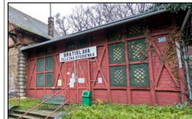
Čakáreň na druhej strane koľajiska. Podobná bola pri strážnom domčeku, no zhorela.