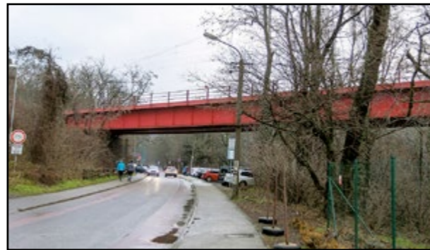
K Červenému mostu sa má pridať nový most s tretou vlakovou koľajou.