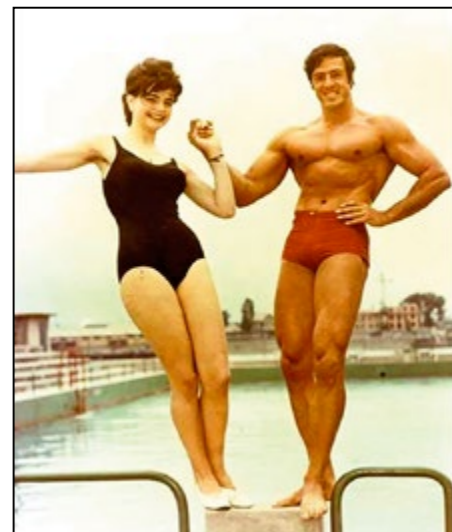
S misskou na kúpalisku Lido