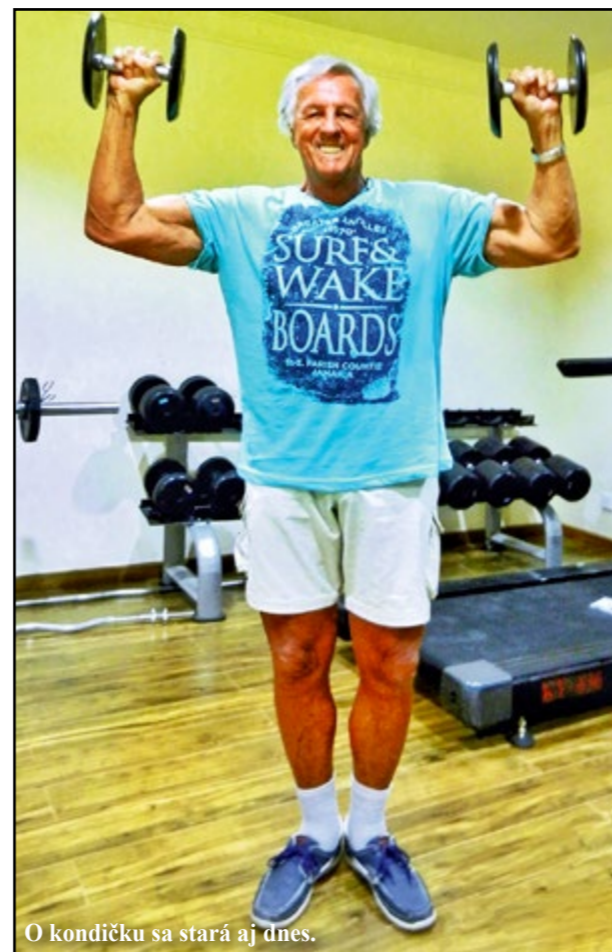
O kondičku sa stará aj dnes.

Tá séria fotiek vznikla niekoľko dní po prvých majstrovstvách ČSSR v kulturistike mužov a juniorov, ktoré boli v bratislavskej Estrádnej hale PKO koncom mája