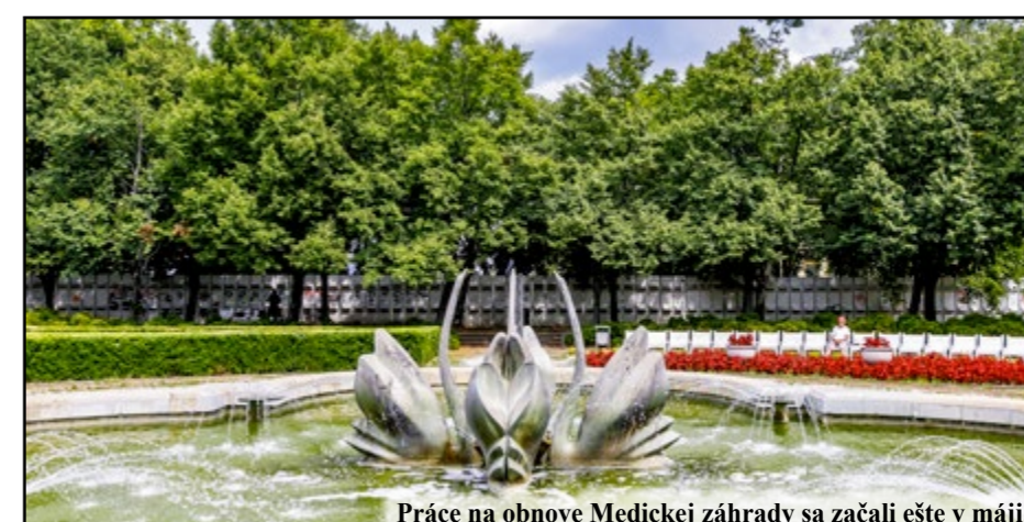
Práce na obnove Medickej záhrady sa začali ešte v máji.

Práce na postupnej revitalizácii Medickej záhrady sa začali už v máji. Nový vzhľad získavajú aj parkové lavičky, ktoré v minulosti mestská časť ošetrovala len novým