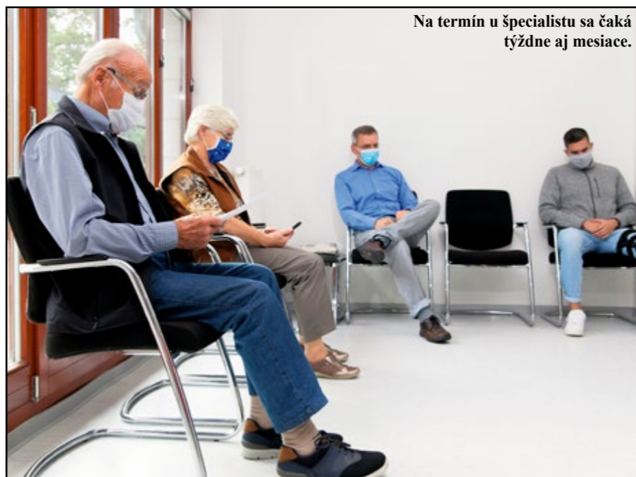
Na termín u špecialistu sa čaká týždne aj mesiace.

„Administratívny počet lekárov, resp. odborných ambulancií v Bratislavskom kraji je v súlade s Nariadením