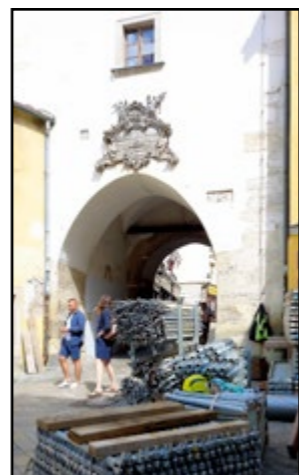
Zvýrazní obnova rohové bosáže na fasáde?