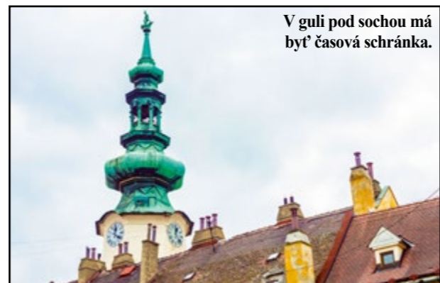
V guľi pod sochou má byť časová schránka.

kou, pričom pôvodne tvorila dominantnú a zjavne viditeľnú architektonickú štruktúru veže. Je škoda, že súčasná rekonštrukcia nerešpektuje prednosti zachovaných gotických foriem hmoty veže...“ Výsledok opráv Urbanovej veže označil za nevydarený architektonický hybrid. Aké sú teda zámery pri obnove fasády Michalskej veže, ktorá je súčasťou generálnej obnovy tejto historickej pamiatky z 15. storočia? Z Múzea mesta Bratislavy, ktoré objekt spravuje, sme