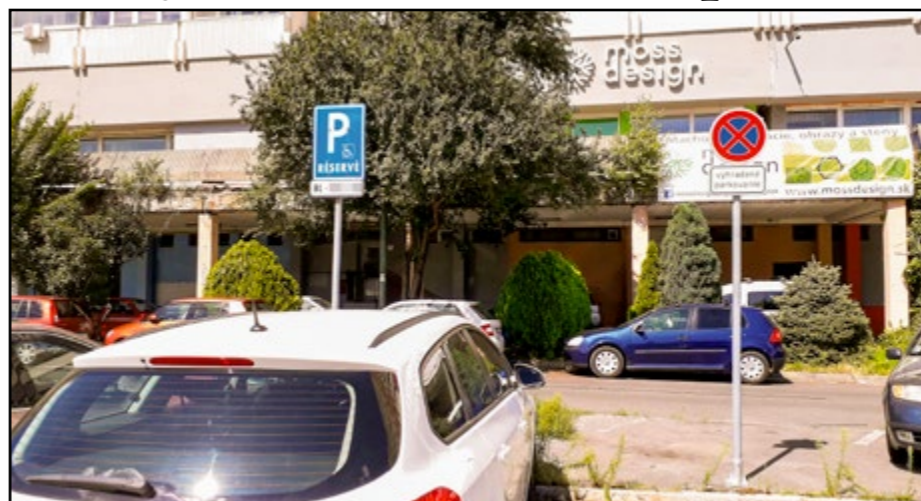
Na nových značkách (vpravo) už nie je uvedené EČV vozidlo.

aj v Petržalke. „Ak si človek v súčasnosti požiadava o vyhradené parkovacie miesto, bude mu určená už nová dopravná značka. Všetky pôvodné značky ostávajú rovnako v platnosti, ale časom by mali byť vymenené podľa novej vyhlášky. Platnosť značiek osadených do 31. marca 2020 sa kon-