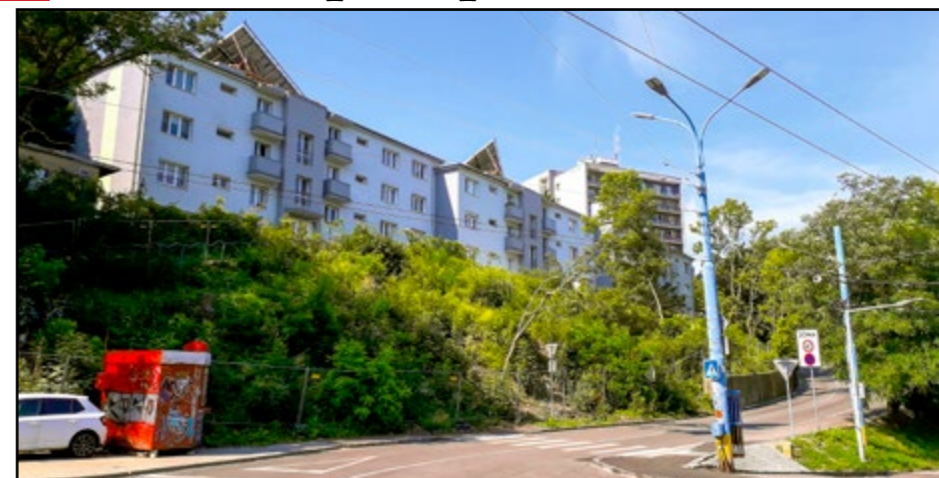
Takto vyzerá rúbanisko na Drotárskej dnes. Začiatkom roka tu zlikvidovali vyše 80 stromov.

Možný návrh riešenia predstavila začiatkom apríla starostka Starého Mesta Zuzana Aufrichtová. Podľa návrhu sa našiel kupec, ktorý je ochotný odkúpiť developerský projekt na Drotárskej ceste. Následne by pozemok vymenil s hlavným mestom za iný, ktorý sa má nachádzať pod budovou patriacou kupcovi. Pozemok