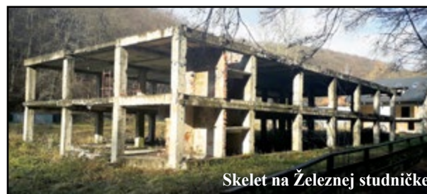
Skelet na Železnej studničke