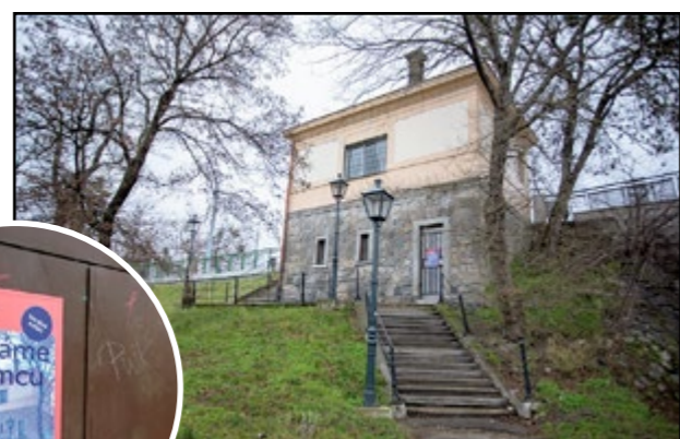
Nájomca sa síce našiel, zmluvu však napokon nepodpísal.

Hoci bola v súťaži uvedená komerčná predpokladaná výška nájmu, každý záujemca mal vo svojej žiadosti priložiť okrem plánu činnosti aj vlastný návrh ceny nájmu. Cieľom totiž bolo pritiahnúť takého nájmcu, ktorý vie doplniť chýbajúce funkcie v okolí