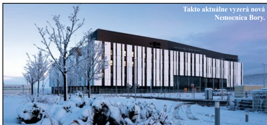
Takto aktuálne vyzerá nová Nemocnica Bory.

LAMAČ Nemocnica Bory, ktorá vyrastá na území mestskej časti Lamač, je takmer dokončená. Otvoria ju na jar budúceho roka a už dnes sa môžete do nej predregistrovať.