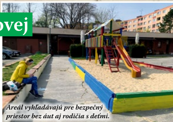
Areál vyhľadávajú pre bezpečný priestor bez áut aj rodičia s deťmi.