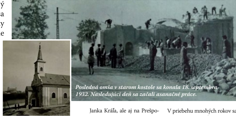
Posledná omša v starom kostole sa konala 18. septembra 1932. Nasledujúci deň sa začali asanačné práce.