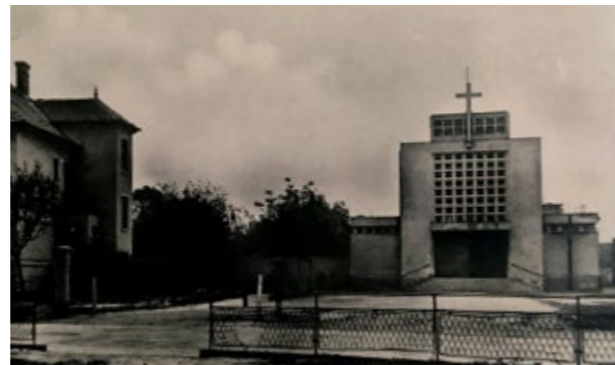
▲ Nový petržalský kostol okolo roku 1947