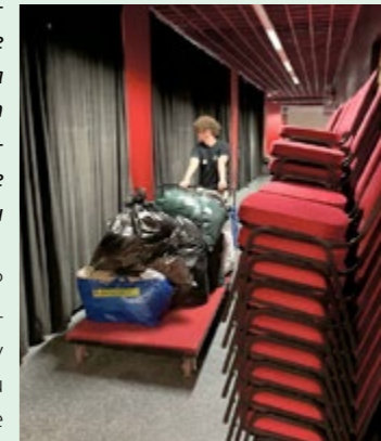
▲ DK Zrkadlový háj opäť slúži na to, na čo je určený. Zbierka sa presunula na Zimný štadión Vladimíra Dzurillu.