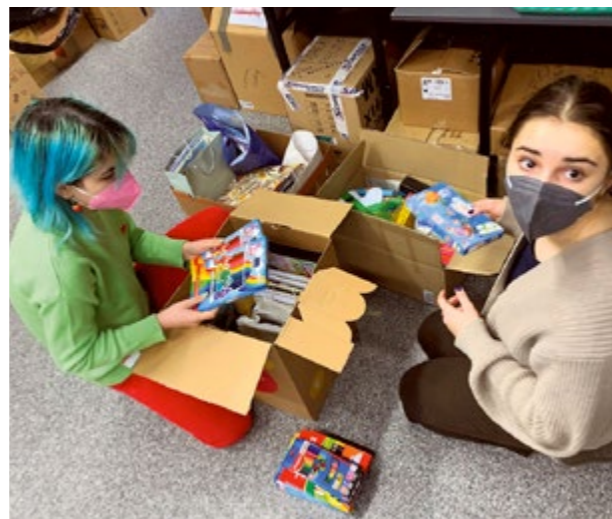
▲ Pomáhali aj študenti z Obchodnej akadémie Imricha Karvaša na Hrobákovej.