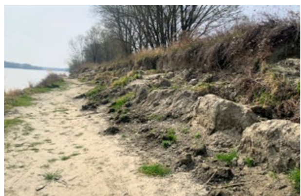
▲ Horný úsek, ktorý bol počas hniezdenia minulý rok vymedzený drevenými zábranami, vydržal.