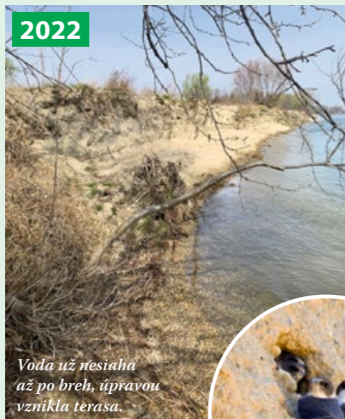
2022 Voda už nesiahá až po breh, úpravou vznikla terasa.