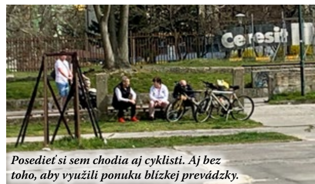
Posediť si sem chodia aj cyklisti. Aj bez toho, aby využili ponuku blízkej prevádzky.

ako bezbariérová skratka sídliskom. V lete si tu mamičky rozložia deky a malé bazény a urobia piknik. Hrá sa tu bedminton, futbal, chodia sem tínedžeri z blízkej školy...“ Studeničová preberala tunajšiu piváreň počas pandémie a videli potenciál príslušného areálu. Po dohode s volejbalistami Slávie UK, ktorí pozemok patriaci mestu spravujú, začali pomaly premieňať tento brownfield na voľnočasový areál.