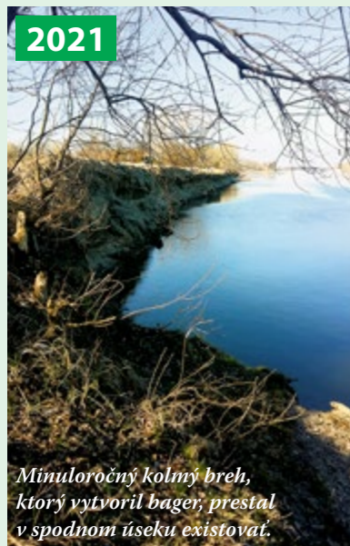
2021 Minuloročný kolmý breh, ktorý vytvoril bager, prestal v spodnom úseku existovať.