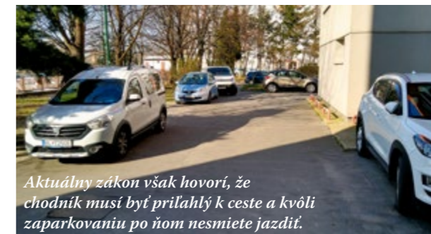
Aktuálny zákon však hovorí, že chodník musí byť príľahlý k ceste a kvôli zaparkovaniu po ňom nesmiete jazdiť.

níku vôbec stáť, a to z 3 500 kilogramov na 2 800 kilogramov. „Ak niektorí motoristi pokutu za parkovanie na chodníkoch, ktoré bolo niekoľko týždňov