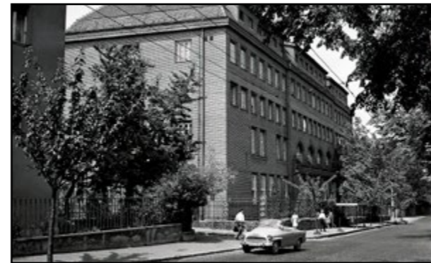
Budova kliniky na Partizánskej ulici

Operácia 54-ročnej Šarloty Horváthovej, ktorá mala kombinovanú chlopňovú