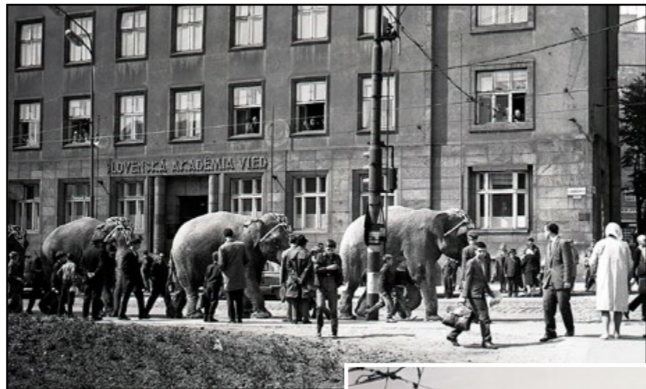
Slony na Štefánikovej ulici zaujali mnohých Bratislavčanov.

BRATISLAVA Indické slony, Starší Bratislavčania si ešte pamätajú netradičný sprievod, keď ulicami mesta prechádzal zverinec slávneho cirkusu Humberto. Dobový záber z 23. apríla 1966 zvečnil aj kaplnku, ktorá navždy zmizla z Račianskeho mýta. Mnohí netušia, že tam niekedy vôbec bola. (TASR)