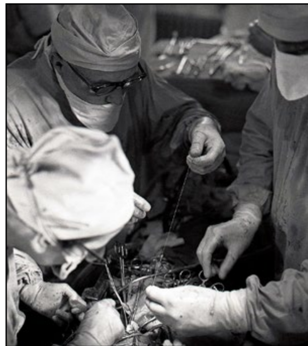
Prvá transplantácia srdca sa u nás uskutočnila len niekoľko mesiacov po premiére Christiana Barnarda.