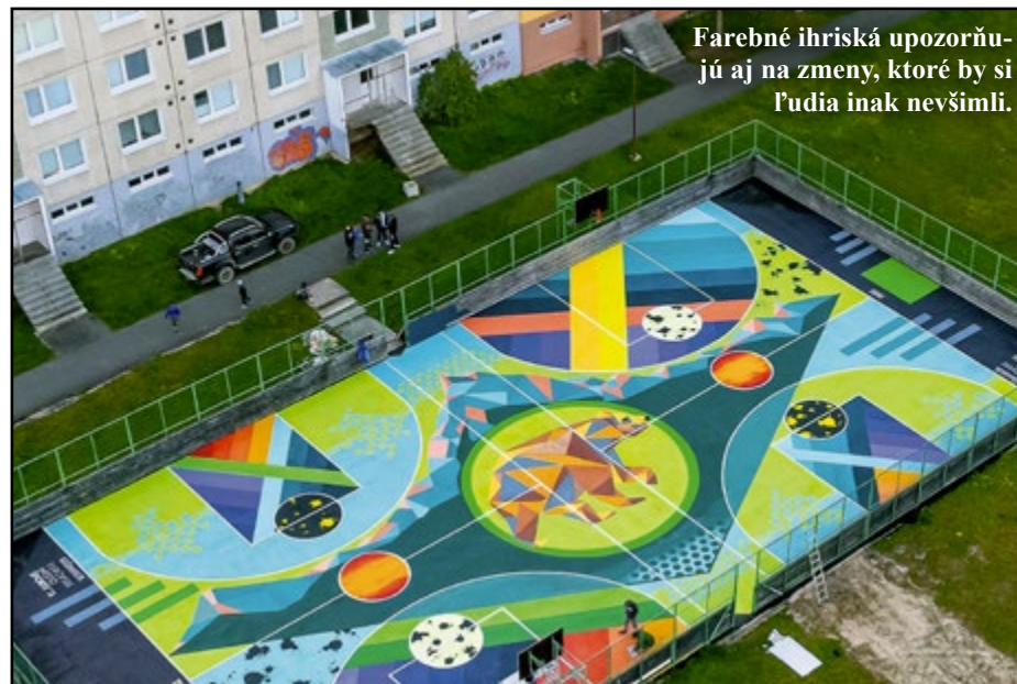
Farebné ihriská upozorňujú aj na zmeny, ktoré by si ľudia inak nevšimli.