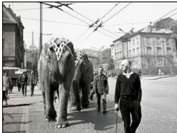
Sprievod pokračoval po Šancovej ulici.

BRATISLAVA Indické slony, Starší Bratislavčania si ešte pamätajú netradičný sprievod, keď ulicami mesta prechádzal zverinec slávneho cirkusu Humberto. Dobový záber z 23. apríla 1966 zvečnil aj kaplnku, ktorá navždy zmizla z Račianskeho mýta. Mnohí netušia, že tam niekedy vôbec bola. (TASR)