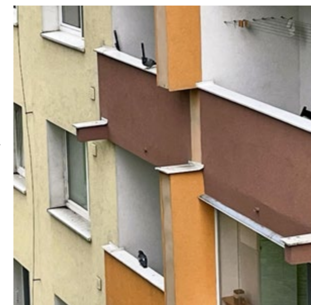
▲ Balkóny sa stávajú obľúbené hlavne vtedy, keď sú nevyužívané, s množstvom poličiek, kvetináčov či skriniek.

na vlastníkoch/správcovi. „Znečisťovaniu fasády a lodžii je možné predchádzať napríklad inštaláciou ochranných sietí, gélov alebo hrotových zábran,“ odporúča samospráva. Rovnako ako zabezpečenie medzier či odchyt holubov. „Predovšetkým je však potrebné medzi ich prikrmovaniu zo strany obyvateľov. Holuby, ktoré si zvykli na pravidelný prísun potravy, sa zdržujú v jeho blízkosti,“ dodáva hovorkyňa.