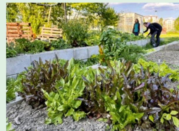
▲ Do rozbehnutej komunitnej záhrady nie je ľahké sa dostať. Aj Polka má svoj zoznam záujemcov-čakatelov. Prísť sem zrelaxovať však môže každý.

Ponúk, čo by sa dalo v tomto priestore robiť, mali Saleziáni veľa. „My sme ich zrejme presvedčili, že sme schopní to udržiavať,“ usmieva sa iniciátorka, ktorá už mala skúsenosti z prvej petržalskej komunitnej záhrady Koza v háji. Pochopila však, že vzdialenosť záhrady od domu je kľúčová.