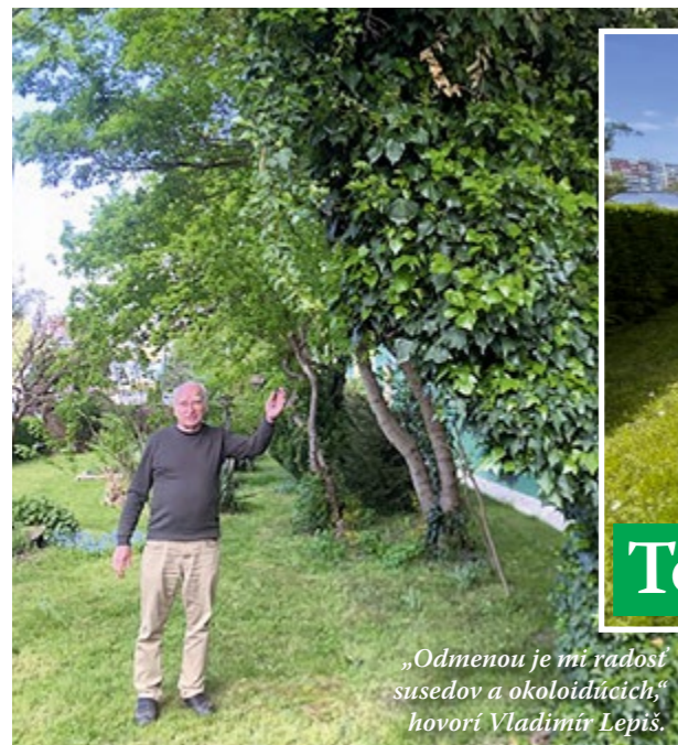
„Odmenou je mi radosť susedov a okoloidúcich,“ hovorí Vladimír Lepiš.