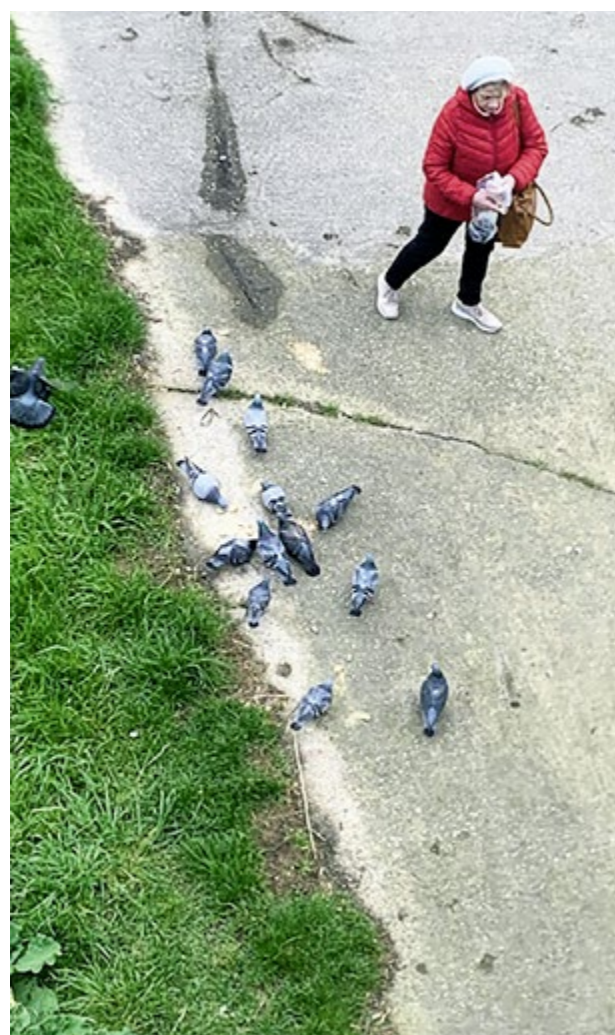
▲ Pohodrať si môžete aj na dôchodcov, ktorí krmia holuby.