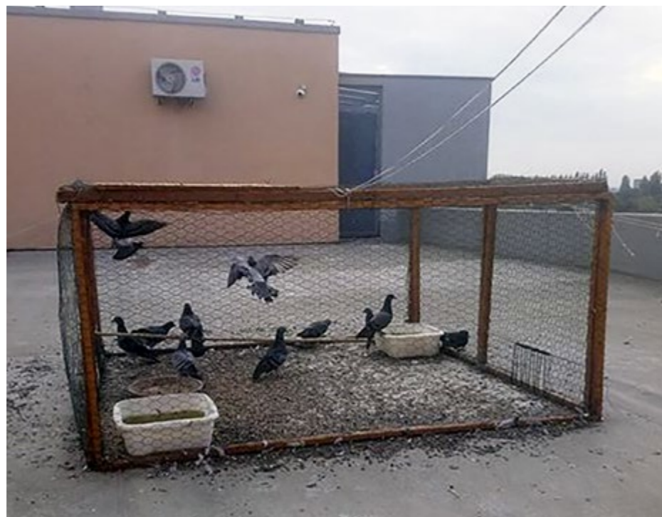
▲ Odchyt holubov na bytovke na Pečnianskej.

odchytových klieťok s rozmermi 1,5 x 2 metre, každá má nádobu na vodu, misku s krmivom, bydlu, striešku.