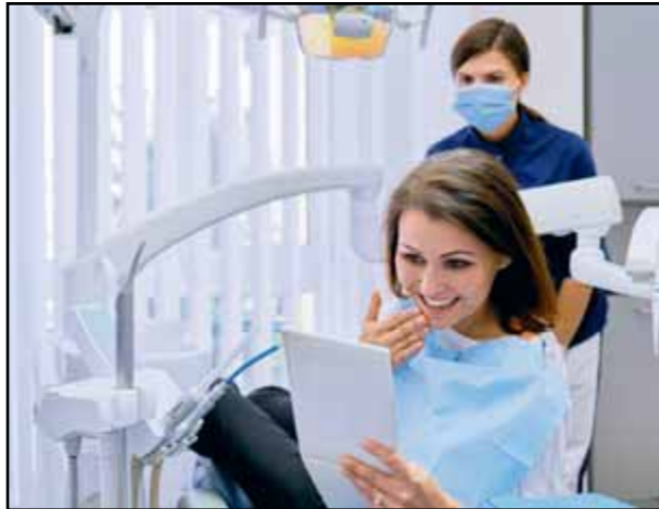
Profesionálnu dentálnu hygienu je ideálne absolvovať dvakrát do roka.

V jednom i druhom prípade pomôže kvalitná dentálna hygiena, pričom sa určite treba raz za čas – ideálne dvakrát do roka - zveriť do rúk profesionálov. Aj keď sa totiž o svoje zuby staráte pravidelne a svedomite, nedokážete si ich vyčistiť dôkladne všade, kde treba. Nejde pritom len o odstránenie zubného kameňa alebo pigmentácie, ale predovšetkým o zdravie zuba-