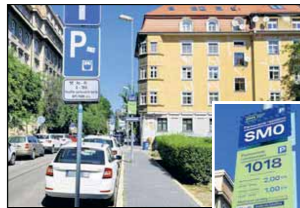
Mesto preberá parkovacie miesta BPS Park, značky firmy sú už odstránené.

Registrácia pre zónu Centrum - Panenská sa začala v pondelok 3. júla, pričom magistrát opakovane vyzýval ľudí, ktorí majú vyhradené miesta na základe zmluvy s BPS Park, aby to nahlásili na klientskom centre PAAS. V opačnom prípade sa k dátumu spustenia novej zóny 31. júla zrušia, takže už nebudú môcť na nich parkovať. Súkromná spoločnosť BPS Park, ktorá celé roky zarabala