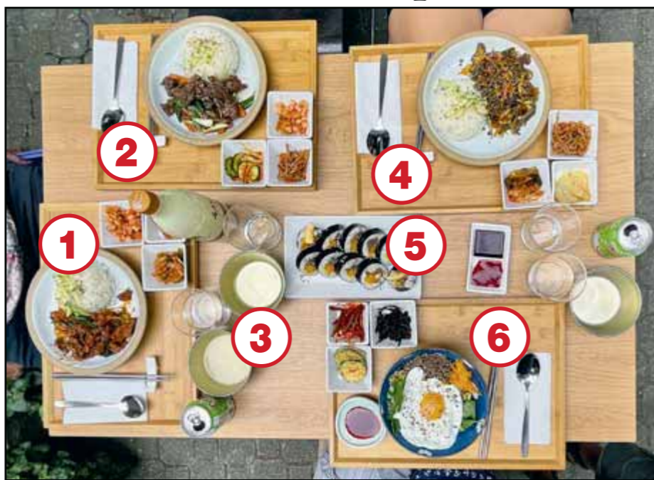
1 Ďejuk / Jeyuk, 2 Bulgogi, 3 Ryžové víno, 4 Čapče / Japche, 5 rolka Kimpap, 6 Bibimbap

ciak. Ale opatrne, hoci obsahuje len 6 % alkoholu, aj po malom dúšku ho citíte.