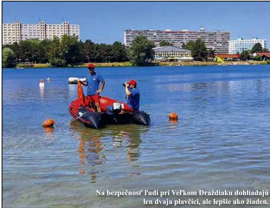
Na bezpečnosť ľudí pri Veľkom Draždiaku dohliadajú len dvaja plavčíci, ale lepšie ako žiaden.