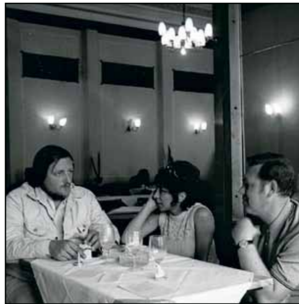
Šansonierka Hana Hegerová a skladateľ Zdeněk Rytíř v kaviarni hotela Carlton v júni 1970.

Tento citát a ďalšie spomienky príslušníkov medzivojnového avantgardy len potvrdzujú dôležitosť kaviarní v tomto období. Ešte v 60. a 70. rokoch dožívali kaviarne z prvej republiky – a hoci aj v zuboženej podobe si zachovali punc čohosi zvláštneho... V kaviarni sa dala čerpať inšpirácia, ale aj pokojne sedieť a pozorovať dianie okolo seba. Maďarský spisovateľ Dezső Kosztolányi (1885 –