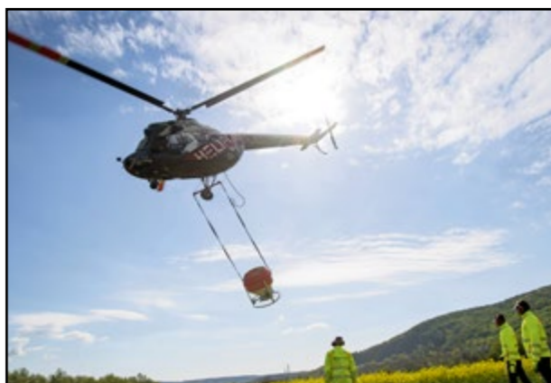
Veľkoplášny zásah zo vzduchu zvolilo mesto pre náročnosť terénu.

Aj počas tohtoročnej sezóny mesto monitoruje liahniská a likviduje larvy komárov prostredníctvom látky BTI. Ide o biologický larvicid, ktorý pri správnej aplikácii dokáže zničiť 100 percent lariev v liahnisku skôr, ako sa z nich stihnú vyliahnuť komáre. Na rozdiel od chemických postrekov so škodlivými účinkami na zdravie ľudí i životné prostredie BTI účinkuje výlučne na larvy komárov. Odborníci a dobrovoľníci skontrolovali od marca viac ako 2 600 potenciálnych liahnísk a spravili viac ako 60 zásahov v rôznych lokalitách, napríklad v Petržalke, Jarovciach, Záhorskej Bystrici, Podunajských Biskupiciach či vo Vajnoroch. V oblasti Devinskej Novej