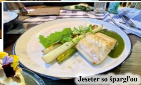
Jeseter so špargľou