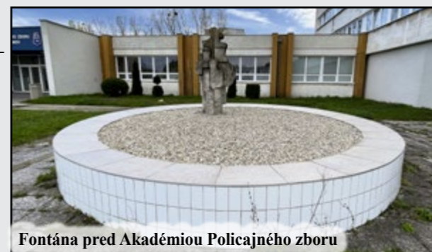
Fontána pred Akadémiou Policajného zboru