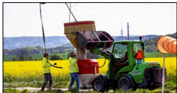
Dopĺňanie zásobníka na postrek larvicidom BTI