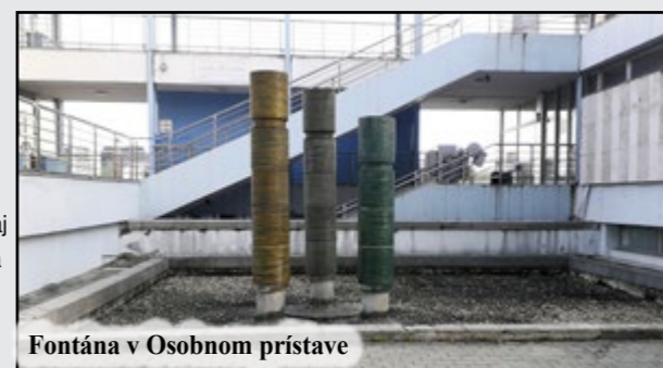
Fontána v Osobnom prístave