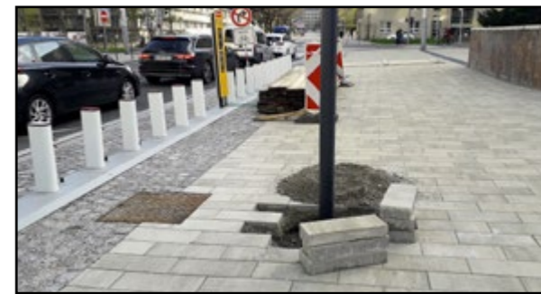
Novú dlažbu na niektorých miestach rozobrali kvôli inštalácii verejného osvetlenia (foto z 20. apríla).