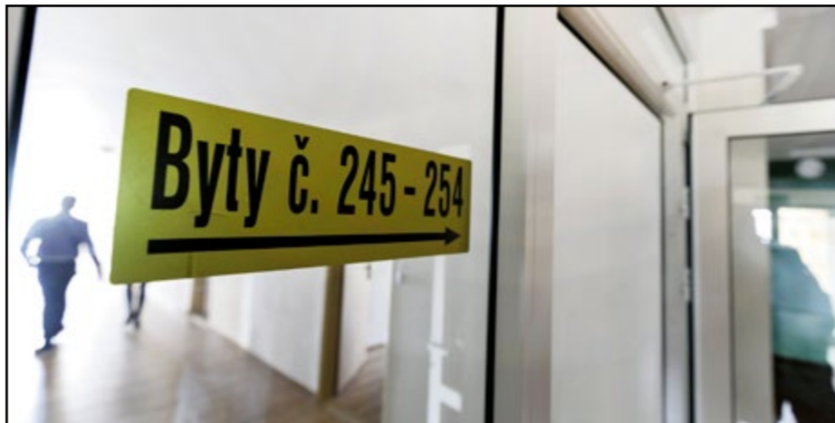
Pravidlá pridelovania mestských bytov zmení nové všeobecne záväzné nariadenie.