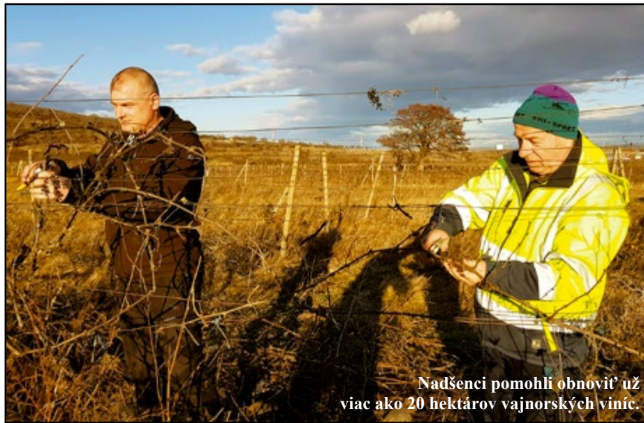
Nadšenci pomohli obnoviť už viac ako 20 hektárov vajnorských viníc.