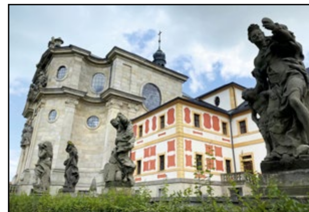
Po ceste určite nevynechajte návštevu hospiálu Kuk.