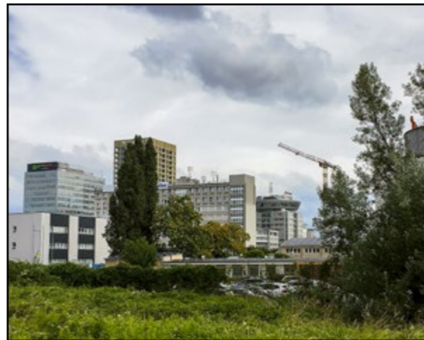
Nová štvrť má vzniknúť v málo využívanom území po bývalých priemyselných areáloch.