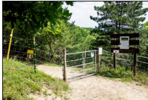
Národná prírodná rezervácia Devínska Kobyla je v súčasnosti len na ploche 101,12 hektára.

Vyhlasením prírodnej rezervácie sa majú ochrániť dubovo-hrabové lesy, lipovo-javorové sutinové lesy či suchomilné travinno-bylinné a krovinné porasty. Zo živočíchov sú to kováčik fialový, hubár jednorohý a netopiere. Ochrániť sa tiež má Sandberg, príbojová jaskyňa, kremencové skaly, krasová