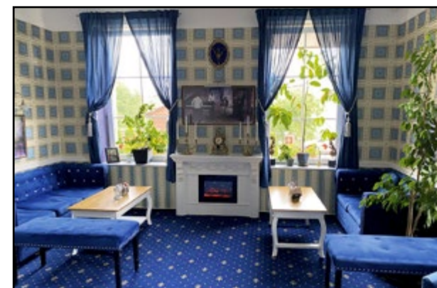
Samoobslužná kaviareň Luissa café vo wellness hoteli Tommy mala úžasnú atmosféru.