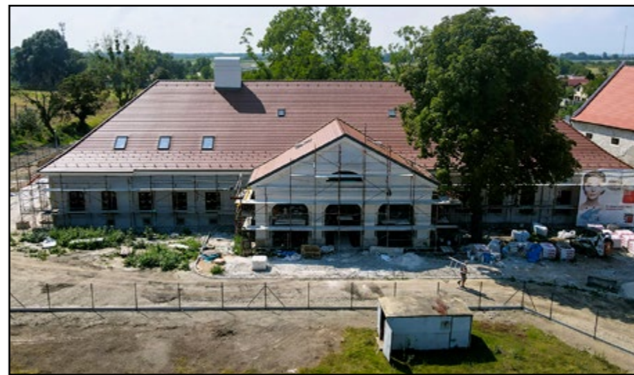
V zrekonštruovanom kaštieli bude moderné interaktívne ekocentrum.