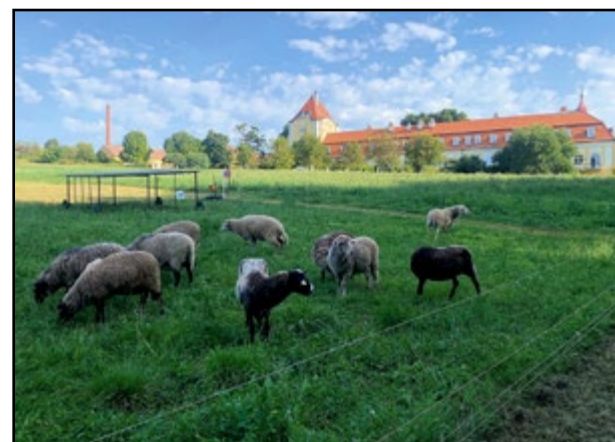
Najmä deti sa potešia zvieratkám v areáli.