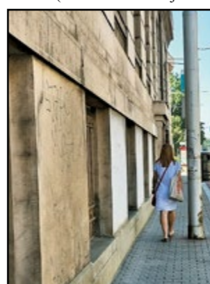
Pred Šafárikovým námestím je za cyklotrasa luxusne široká, priestor sa mohol využiť na rozšírenie chodníka pre peších.

Cyklotrasa, vybudovaná na nábreží v rámci cestnej komunikácie, je možno až luxusne široká (i keď nie v celej dĺž-