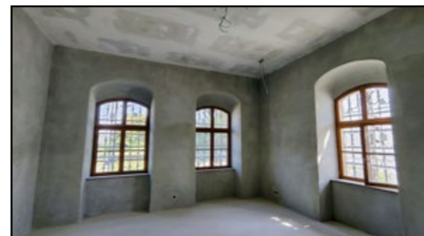
Práce v interiéri sú takmer hotové.