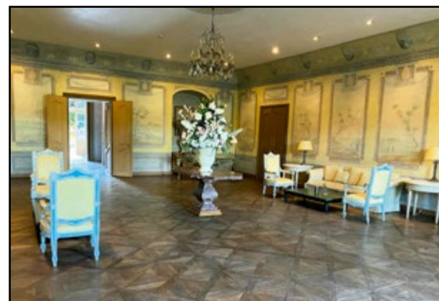
Pôvodné fresky sa podarilo zachovať.

Hneď, ako sme sa ubytovali, vybrali sme sa na prechádzku do obrovskej krásnej záhrady, ktorá patrí ku kaštieľu. Cestou sme natrafili na ovečky i bieleho ponika a v diaľke na kopci sme zahliadli pasúce sa kravy. Prešli sme sa voňavou bylinkovou záhradou, objavili sme tu aj malý vinohrad, ovocné stromy a malebné jazierko s množstvom rýb... chajúci históriou, ktorá siaha až do 18. storočia. Hneď pri vstupe do kaštieľa za recepciou sme obdivovali pôvodné fresky, ktoré sa podarilo zachovať. No nielen táto miestnosť je očarujúca, hotel zariadil i ďalšie salóniky s atmosférou spred stáročí, kde sa dá posediť, pričom každý jeden je výnimočný, iný. Aj izby sú zariadené štýlovo, s nádychom histórie. Ocenili sme tiež, že sú dostatočne veľké, s množstvom úložného priestoru, komfortné a čisté. Naša izba nemala klimatizáciu, iba ventilátor, v prípade záujmu sa však dá zarezervovať si izbu s klimatizáciou.