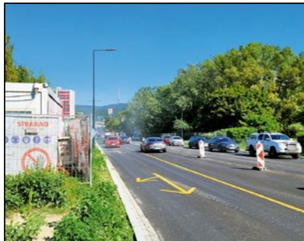
Rozšírená Harmincova zlepši komfort vodičom, cestujúcim MHD aj chodcom.