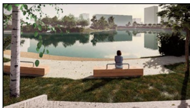
Obnovené okolie jazera na vizualizácii

vzišlo z výtvarno-architektonickej súťaže. Obete pandémie na Slovensku majú v budúcnosti pripomínať vlny na jazere Rohlík. Na siedmich mólach po obvode jazera majú byť inštalované zariadenia na vytváranie umelých vln, ktoré aktivuje návštevník postavením sa na určené miesto na danom môle. Architekti tiež navrhujú sieť chodníkov okolo jazera.