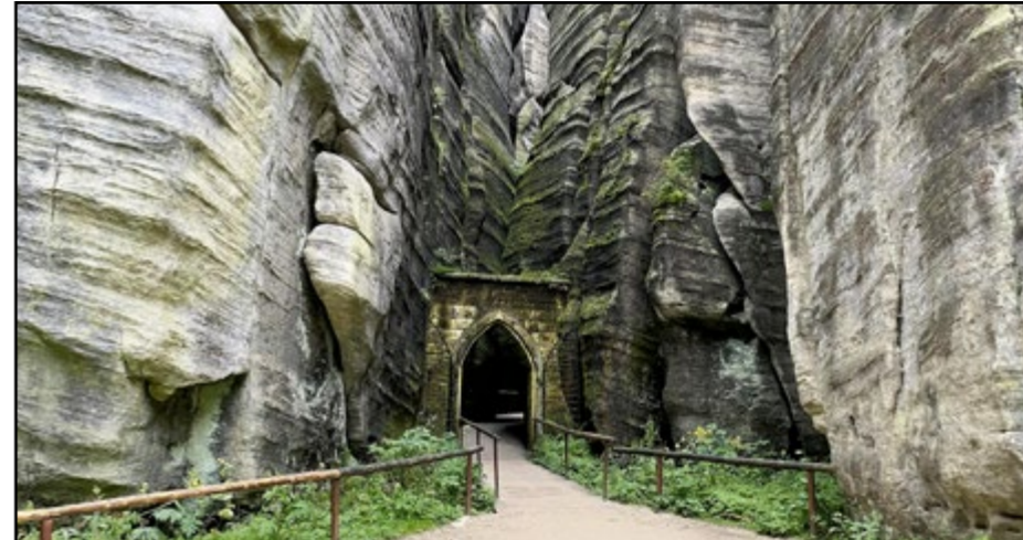
Skalná brána patrí k najznámejším atrakciám Adršpašských skál.

Druhá atrakcia, tzv. Babičkin údol, je z iného súdka. Po nádychu tajomna na