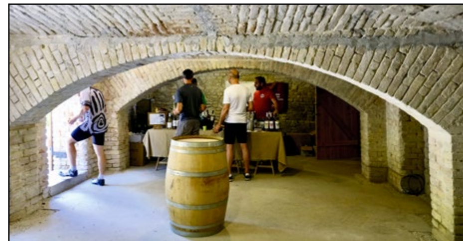
Archiťektúri zachovali pôvodné priestory polozapustenej pivnice.

Ako informoval Metropolitný inštitút Bratislavy (MIB), pôvodná hájovňa pochádza