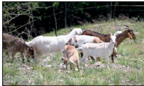
Stepný ráz na Devínskej Kobyle pomohli obnoviť kozy.