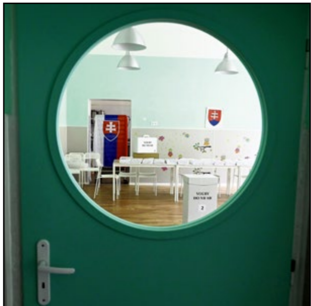
Voľbné miestnosti sa otvoria 30. septembra o 7. hodine.

Z nízkej účasti by profitovali strany, ktoré majú stabilných voličov. V prvom rade Smer-SD. Naopak, pri vysokej účasti by mohli byť ohrozené strany nachádzajúce sa na hranici zvoliteľnosti. V každom prípade ale platí, že veľa voličov so záujmom ísť voliť zatiaľ nie je úplne rozhodnutých, koho nakoniec vo voľbách podporia. Takže, všetko môže byť úplne inak, ako sa dnes zdá.