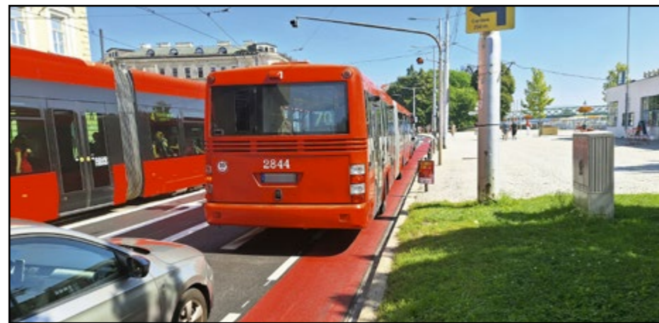
Na niektorých miestach je cyklopruh úzky – pri Propeleri obsadil autobus MHD viac ako polovicu nášho priestoru.