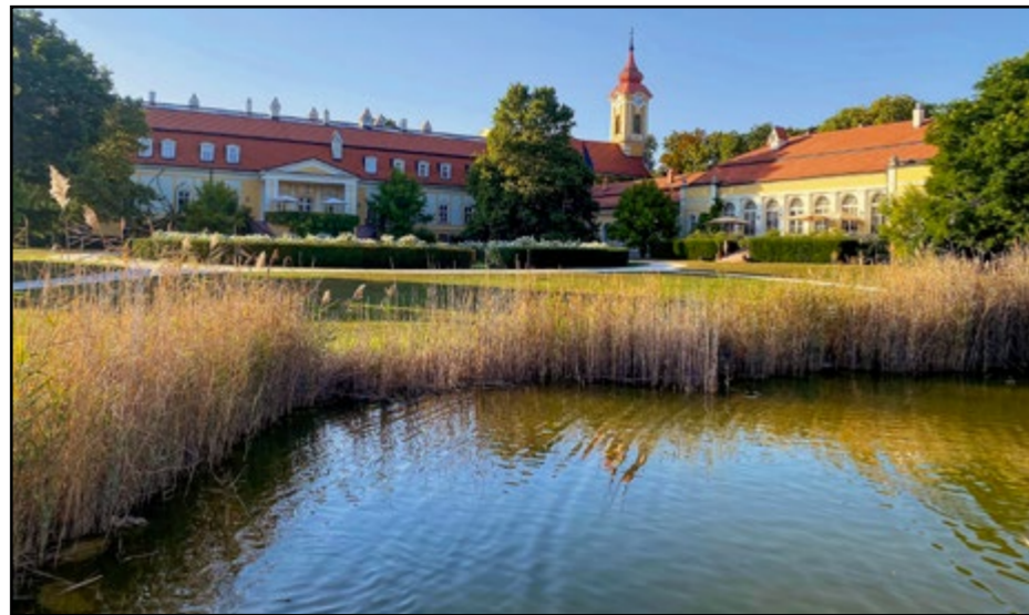
Pohľad na historický kaštieľ a jazero. Môžete si vyskúšať aj rybolov typu „chyt' a pust'“.

Z Bratislavy do dedinky Belá na južnom Slovensku je to približne 150 kilometrov, takže ak sa vydáte na cestu autom, za necelé dve hodinky ste v celi a môžete si vychutnávať pobyt v príjemnom a pokojnom prostredí. Zaparkovali sme bez problémov pred hotelom, ďalšia možnosť je na krytých parkovacích miestach v areáli. Na malú chvíľu môžete zastaviť autom aj priamo pred