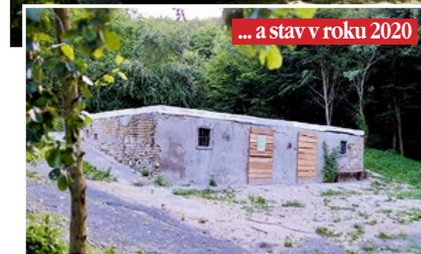
... a stav v roku 2020