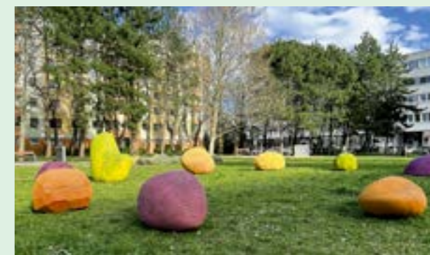
▲ Park na Námestí Hraničiarov sa spája aj s 50. výročím založenia najväčšieho sídliska na Slovensku. Nachádza sa tu pamätná tabuľa začiatku výstavby, pamätný strom, aj sochárske dielo „A String of Pearls“ z projektu Stromorodie.