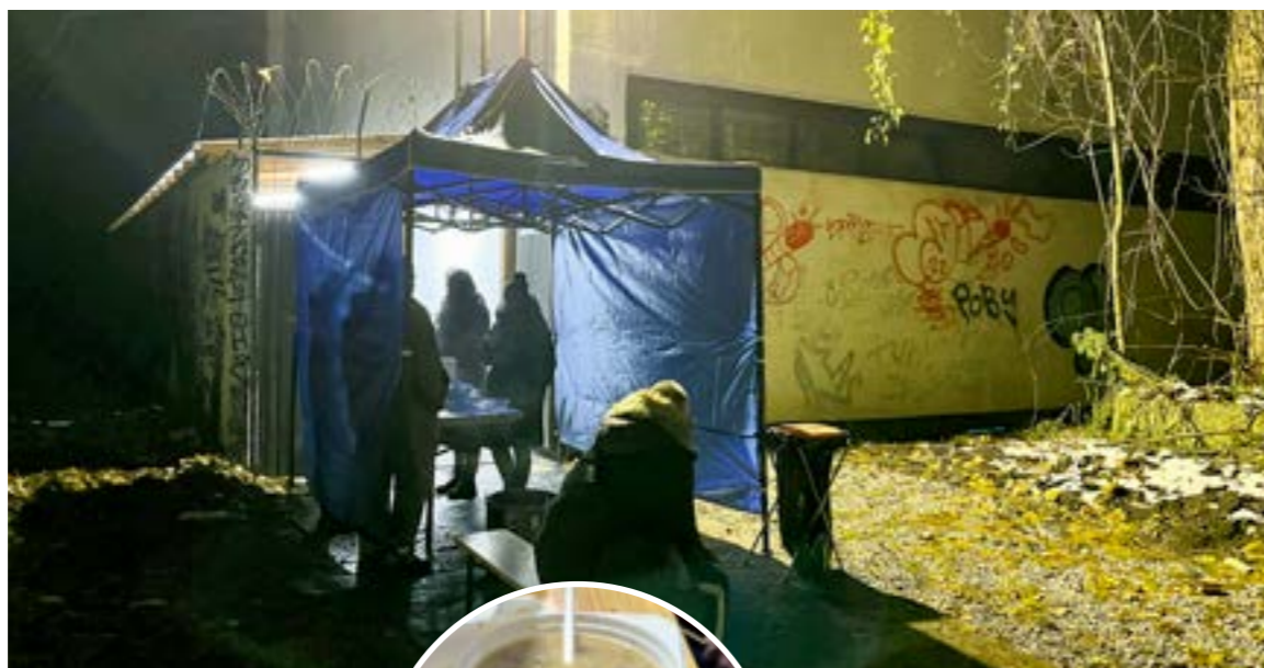
▲ Výdajňa je „ukrytá“ v kotolni na Haanovej neďaleko kaplnky v starohájskom lesíku.