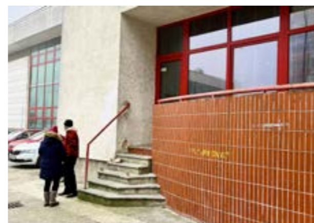
▲ Na bočnej terase DK Zrkadlový háj ponúka samospráva každý utorok od 10.00 do 11.30h teplé nápoje.