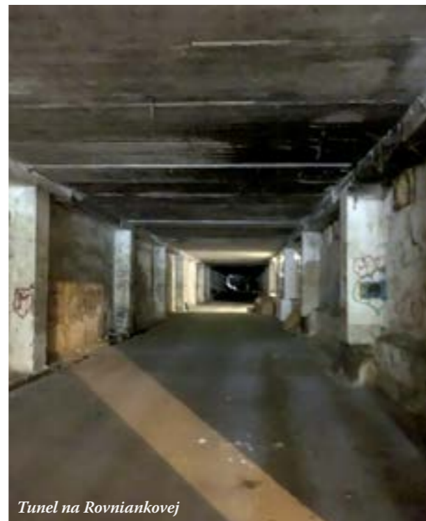
Tunel na Rovniankovej