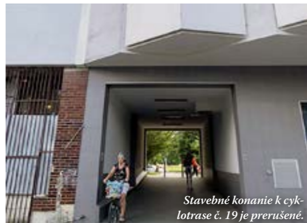
Stavebné konanie k cyklotrase č. 19 je prerušené.

■ Petržalská matrika patrí v rámci bratislavských mestských častí k najvyťaženejším. V roku 2023 tu vybavili aj 194 žiadostí o skrátenie priezviska pre dievča (bez slovenského prechýľovania). (mh)