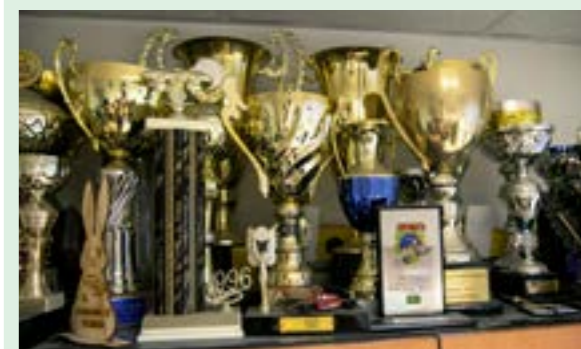
▲ Víťazné trofeje zaberajú celý regál.