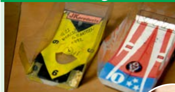
▲ Karoséria „wing car“ pripomína auto skutočne len vzdialene. Zospodu je podvozok, kolesá a motorček. A jednu jeho časť – strator – ktorý automodelári volajú setup, vyrába práve Voki.