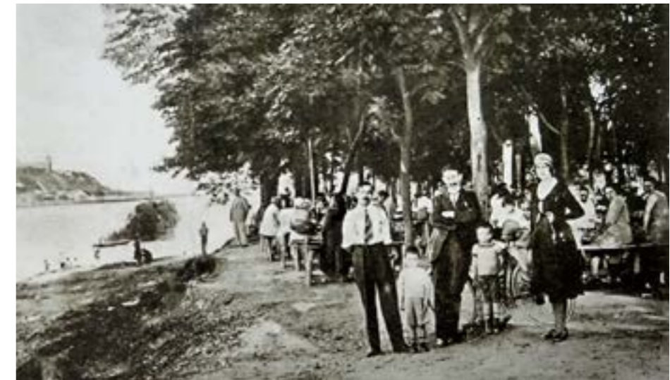
▲ Výletná reštaurácia Krištofek (vľavo v pozadí hrad) okolo roku 1930.

Pri prípravách výstav sme vychádzali z jednotlivých historických predelov a medzníkov významných pre Petržalku. Pri prvej výstave, zahŕňajúcej najdlhšie časové obdobie, sme predstavili dejiny Petržalky do konca 1. svetovej vojny. K najvýznamnejším udalostiam však patrí pripojenie Petržalky k Československu v auguste 1919, vďaka čomu sa Petržalka,