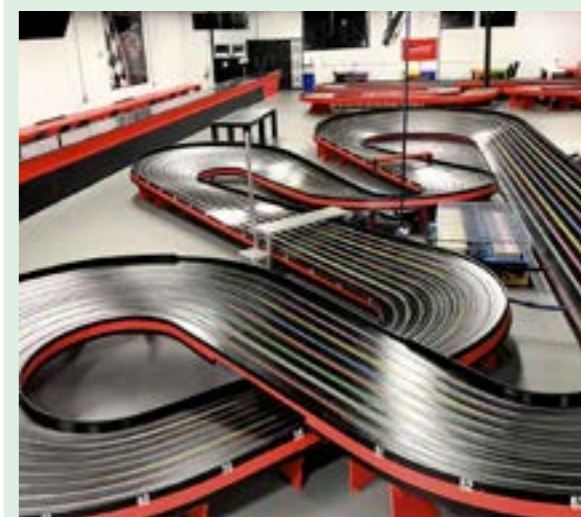
▲ Autodráha typu „Blue King“