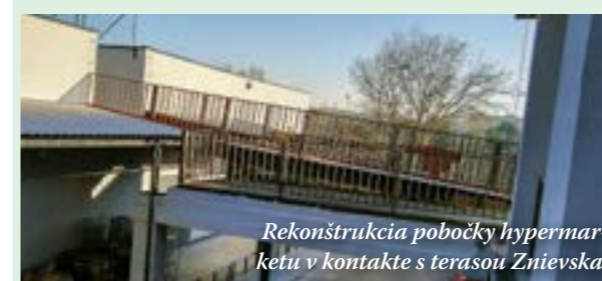
Rekonštrukcia pobočky hypermarketu v kontakte s terasou Znievska.