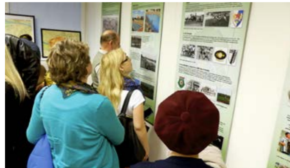
▲ Cyklus výstav Taká bola Petržalka mal medzi obyvateľmi veľký ohlas. Publikácie, ktoré neskôr vyšli, patrili v petržalskej knižnici k najžiadanejším knihám.

Na webovej stránke Filozofickej fakulty, je medzi va-