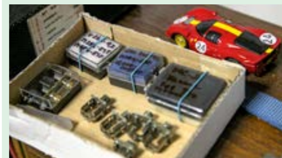
▲ Dokázal by si vyrobiť celé auto od karosérie, cez podvozok až po motor a kedysi to tak aj robil. Veď na Majstrovstvách sveta na ostrove St. Martin v roku 1992 vyhral s vlastným motorom, podvozkom aj karosériou. Neskôr však bolo náročné vyrábať si autá aj stíhať zákazky.