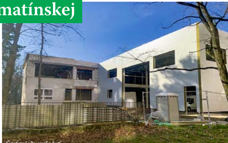
Časť prác by mala byť dokončená do leta, zvyšné do konca tohto roka.

Jediná škola, ktorá má byť v Petržalke po dlhých rokoch postavená od základov, je tá v Slnčniciach. Pôvodne sa projektovala pre súkromnú školu Felix. Projekt získal kladné záväzné stanovisko mesta už pred štyrmi rokmi, územné rozhodnutie má tri roky. Pred dvoma rokmi sa mestská časť rozhodla, že ju chce mať verejnú. „To, či vôbec, alebo v akej podobe škola vznikne, zatiaľ nie je možné povedať,“ informovala nás aktuálne hovorkyňa Petržalky Mária Halašková.