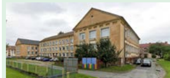
▲ Cirkevná základná škola sv. Jána Krstiteľa v Sabinove