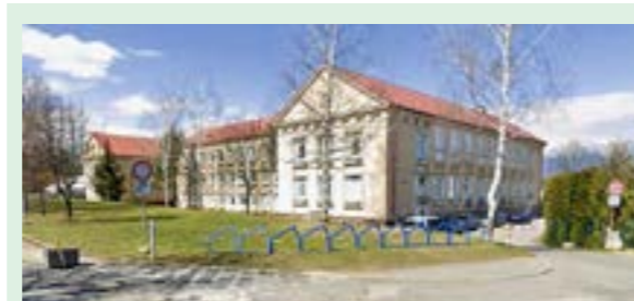
▲ ZŠ a MŠ Francisciho, Poprad.