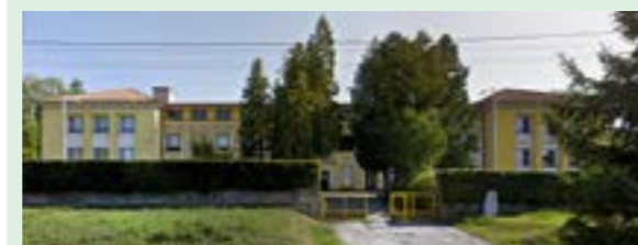
▲ Základná škola s materskou školou - Moravské Lieskové