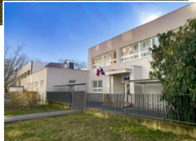
Aktuálne je v menšom zrekonštruovanom trakte sedem tried detí, dve prvácke, tri druhácke a dve tretiacke.

Od roku 2018 sa obyvatelia Tematínskej desili, že im pod oknami vyrastie obytný dom. Ministerstvo práce, sociálnych vecí a rodiny totiž vtedy vymenilo objekt bývalej materskej školy so súkromnou firmou za štyri rodinné domy. Zrejme zabrali petície a protesty, firma objekt v roku 2022 predala, a to zriaďovateľovi školy Felix. Už v septem-