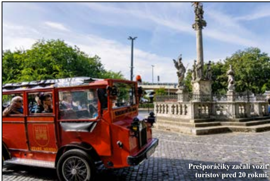
Prešporáčiky začali vozit' turistov pred 20 rokmi.

Medzi múrmi Starej radnice sa odohrávali nielen dôležité epizódy bratislavskej histórie, ale i neviazané zábavy, na ktorých sa tancovalo až do rána.