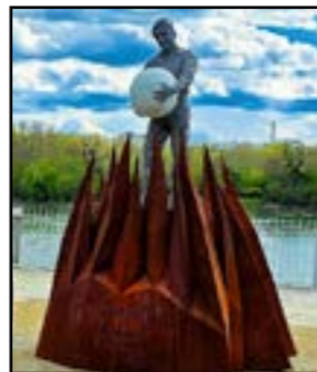
Pamätník Imiho Lichtenfelda