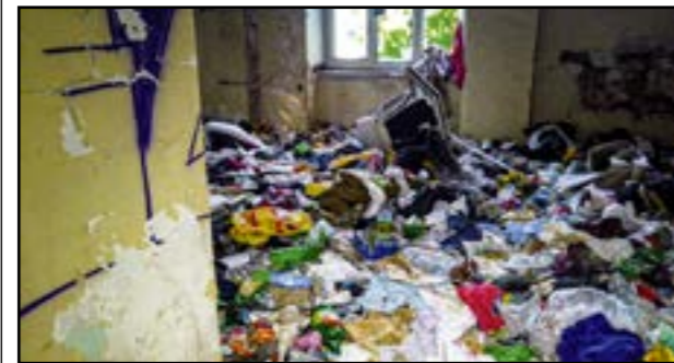
Dom z roku 1920 nechal majiteľ spustiť, dnes ho obývajú narkomani, bezdomovci i rôzni asociáli.