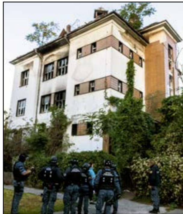
Policajti tu zasahujú každú chvíľu, nedávno objavili v budove i deti.

Nedávno napríklad riešili v okolí objektu padajúce škridle, ktoré silný vietor sfúkaval zo strechy. Pred časom zas prišli na Žabotovu so sociálnou kuratelou pre podozrenie, že v budove sú i deti. „To sa aj potvrdilo, boli tam dve dievčatká, jedno asi ročné a druhé štvorročné s mamou a otcom tej mladšej,“ doplnil hovorca.