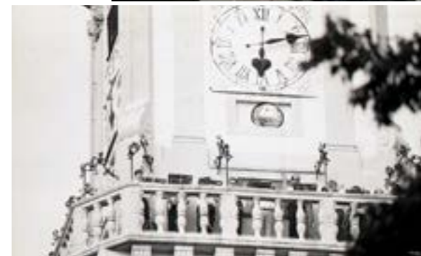
Členovia kapely strážnikov pravidelne pripravovali koncerty, ktoré odznievali z radničnej veže.

Spočiatku sa zábavy pripravovali len v spojení s nejakou mimoriadnou udalosťou: voľbou richtára, pri nástupe nového magistrátu do funkcie alebo pri návšteve panovníka. Neskôr sa veselé hostiny a tancovačky konali aj pri príležitostiach, ktoré sa kedysi oslavili či aspoň pripomenuli v súkromí: svadby mešťanostov, krstiny ich potomkov, ale aj kary po pohreboch významných obyvateľov mesta. Zo zábav pri návšteve cisára vznikli veľkolepé oslavy s tancovačkou do rána, rovnako, ako keď Prešporok navštívili cudzí panovníci, domáci aj zahraniční vodovia, kniežatá či iní významní hostia. A prečo nie? Zveriny bolo v karpatských lesoch dosť, rýb v Dunaji neúrekom, o víne ani nehovoriac. Od Michalskej brány popod kopce až po Trnavu – samý vinohrad. Pre zaujímavosť pripomína-