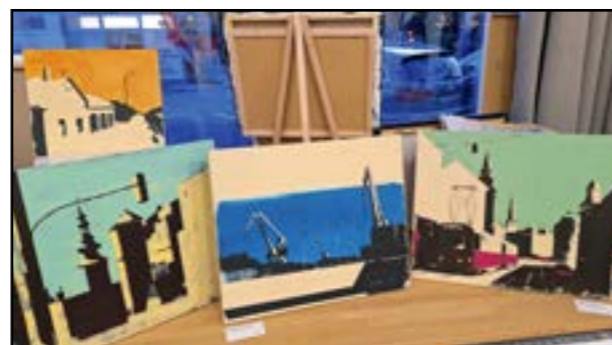
Aj tieto diela vystavoval Marek v Galérii Starý Avion: v popredí zľava Suché mýto, Zimný prístav a Špitálska

Foto: archív M. A., bn Viac foto nájdete na www.banoviny.sk