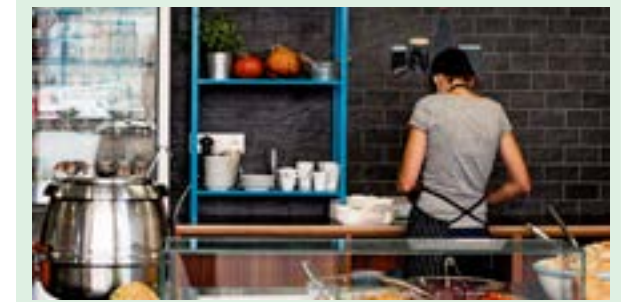
Prevádzka funguje iba v pracovných dňoch do 14-tej hodiny.