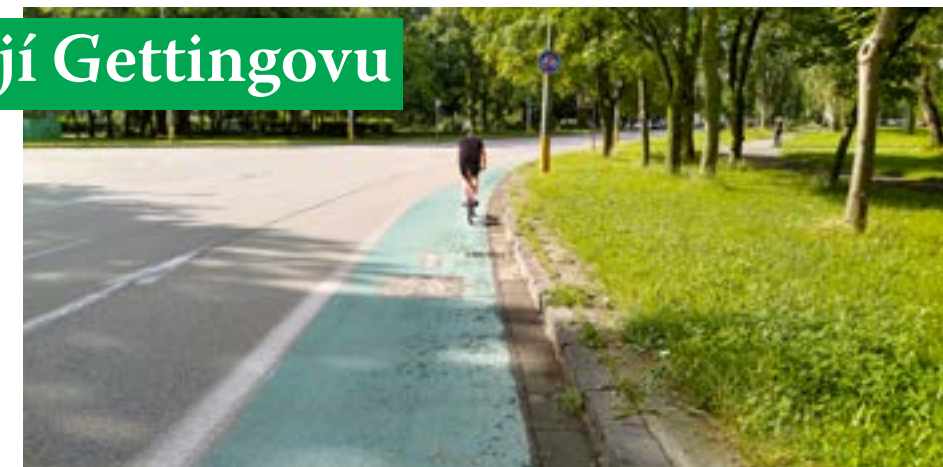
▲ „Zásadnejšej prestavby sa dočká križovatka Mamateyovej a Gettingovej, kde budú vybudované priechody pre cyklistov na všetkých ramenách, čím sa zabezpečí prejazd nielen po trase O4, ale aj po skôr vytvorenej trase po Mamateyovej,“ informuje na svojej webovej stránke Cyklokoalícia.