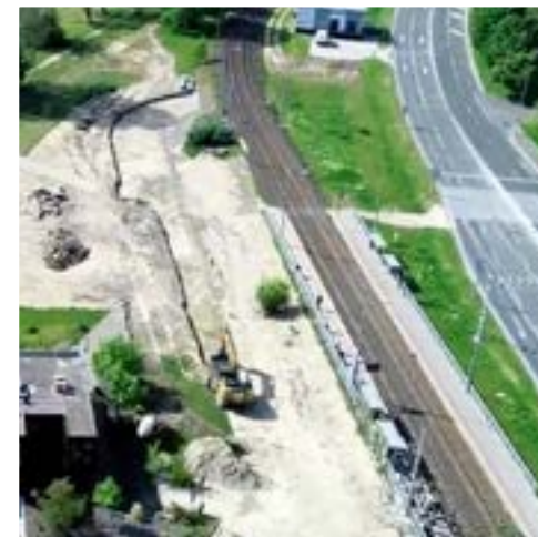
▲ Nová komunikácia pre autobusy vznikne na úkor trávinatej plochy pri Chorvátskom ramene

Prestupný terminál Farského sa buduje so zámerom skvalitnenia a zrýchlenia presunov medzi autobusmi a električkami v tejto lokalite. „Po dobudovaní terminálu doň DPB plánuje presmerovať všetky denné autobusové linky, čím sa podstatne skráti pešie presuny medzi jednotlivými druhmi verejnej dopravy,“ uviedol. Pozdĺž električkovej trate, po celej jej dĺžke, by mala vzniknúť nová cyklotrasa. Nová komunikácia, ktorú dodávateľ realizuje ako prestupný uzol autobusy-električka zmenšil plochu