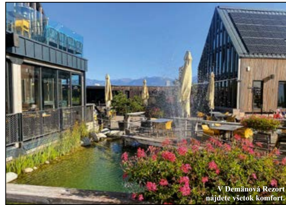
V Demänová Rezort nájdete všetok komfort.

Po prehliadke, ktorá trvala necelú hodinu, sme sa vydali autom hlbšie do doliny, kde nás čakal ďalší z obľúbených výletných cieľov Nizkých Tatier, Vrbické pleso. Okolo plesa vedie turistický chodník, prechádzka je nenáročná, bez stúpania, a otvárajú sa z nej nádherné výhľady na okolité hory. Negatívom je iba areál pod plesom s rozbuženou výstavbou, ktorá ničí charakter miesta. Tu sme sa naozaj nahnevali. Kto neuvidí, neuverí, ako dokáže človek znehodnotiť jeden z najkrajších národných parkov pre dodatočne ubytovacie kapacity, ktorých je aj bez toho v oblasti neúrekom. Náladu nám zlepšila ďalšia malá túra, tentoraz na vrch Ostredok s peknou turistickou rozhľadňou, ktorá sa začína kúsok od Vrbického plesa. Pravdepodobne nepatrí k najvyhľadávanejším túram, ale keby sme chceli, mohli sme si tu tiež požičať bicykel, či