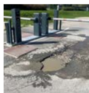
▲ Tyršák: Verejné parkovisko pri Dunaji pripomína tankodrom.

Mestská časť nemá o fonde mobility žiadne informácie ani o výške možných prerozdelených financií zo spomínaného fondu. „Vzhľadom na to, že nevieme, akú výšku financií fond predstavuje, nevieme určiť, aké projekty by sme z týchto peňazí vedeli zrealizovať. Pravdepodobne