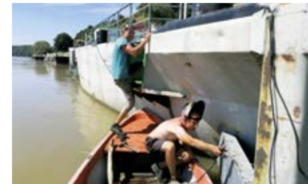
▲ Opravujú aj havárie veľkých lodí a pontóny na Dunaji.