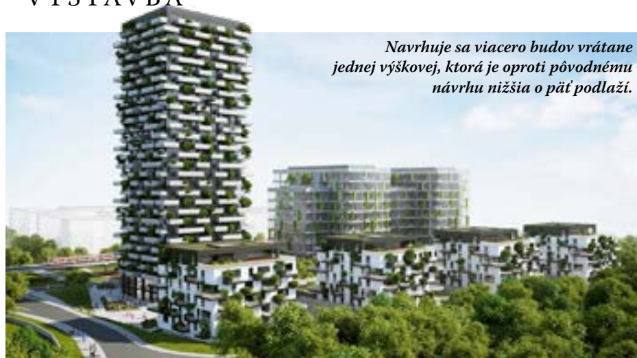
Navrhujú sa viaceré budovy vrátane jednej výškovej, ktorá je oproti pôvodnému návrhu nižšia o päť podlaží.