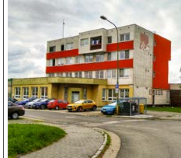
▲ Mestská časť možno odkúpi v tejto budove aj ďalšie byty.