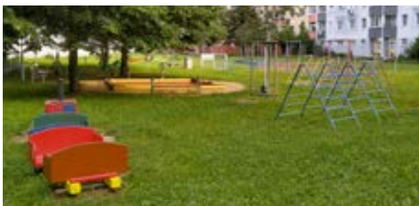
▲ Obnova ihrísk spočíva v obmene herných prvkov.