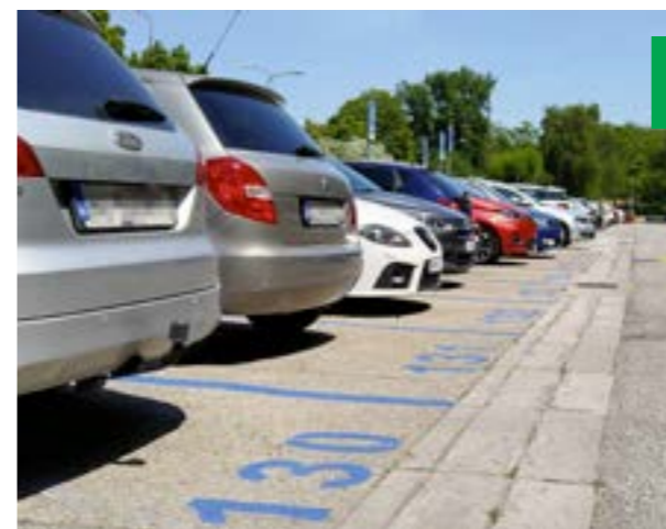
▲ Zavedením celomestskej parkovacej politiky PAAS sa znížil počet parkovacích miest.