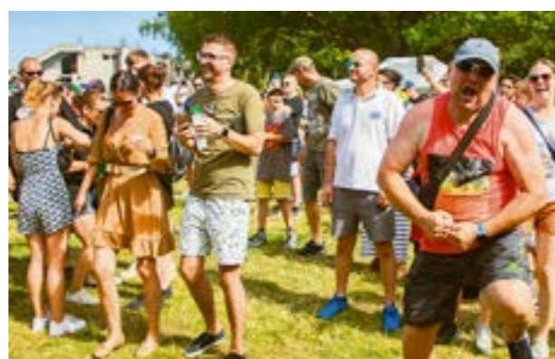
▲ Pred Dňami Petržalky robila pre samosprávu postrek certifikovaná firma.