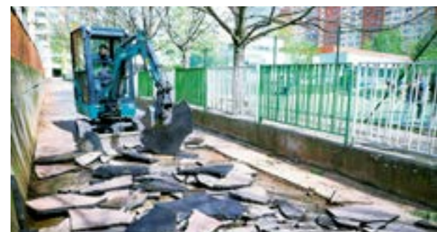
▲ Hydraulické rýpadlo Hydromek

Veľkú opravu chodníkov odštartovala mestská časť po veľkonočných sviatkoch na Dvoroch 4. Nový asfalt stihli odvtedy položiť na Vavilovovej a Wolkrovej ulici a najnovšie tiež v blízkosti dostihovej dráhy na Starohájskej ulici. Rečou čísiel to znamená, že v lokalite Dvory 4 položili nový asfalt na ploche 8 300 m 2