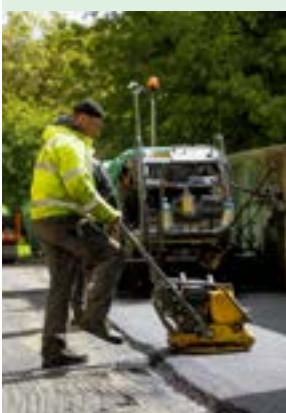
▲ Ručný vibračný zhutňovač

Tohtoročnou opravou chodníkov nadväzuje Petržalka na pilotný projekt z roku 2023, keď si otestovala, ako dokážu opravovať chodníky vo vlastnej réžii a nie dodávateľsky. „Obstarali sme vlastný asfaltovací stroj, tzv. finišer a ďalšiu techniku. Realizácia je výrazne lacnejšia i rýchlejšia, ako tomu bolo v minulos-