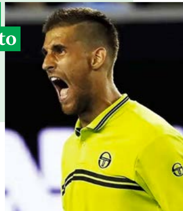
Po návrate na tenisové dvorce vyhral 4 turnaje IHF. Zatiaľ. Jeho cieľom je dostať sa tento rok medzi najlepších 250 tenistov sveta.

Vráťme sa však späť k tenisu... ste hráč, ktorému sa podarilo poraziť hviezdy a dnes už legendy ako Djokovič, či Nadal. Čo sa Vám pri tých spomienkach vybavuje?