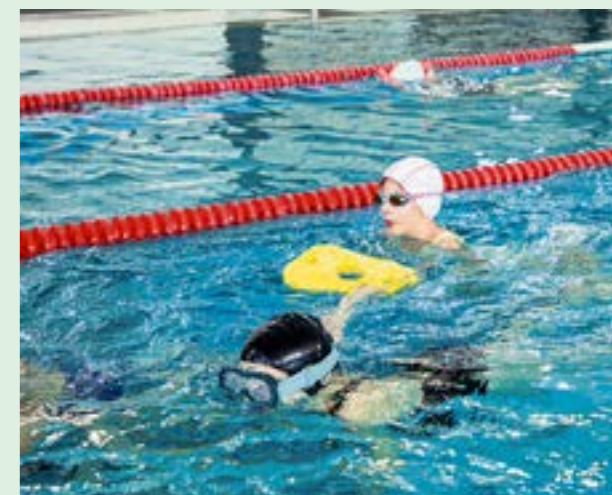
▲ Petržalka obnovuje tradíciu bezplatných plaveckých kurzov pre základné školy. Vďaka pomoci partnerov sa môžu zapojiť všetky.