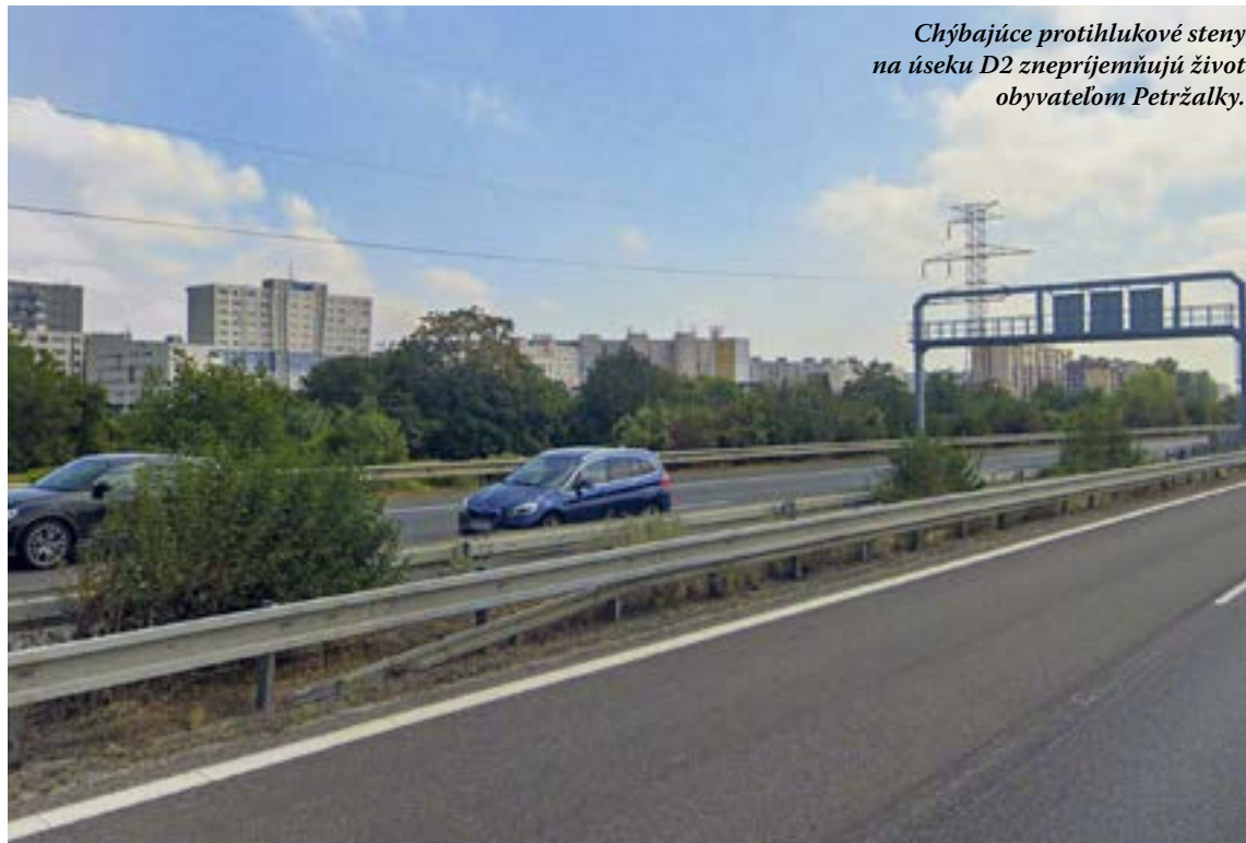
Chýbajúce protihlukové steny na úseku D2 zneprijemňujú život obyvateľom Petržalky.