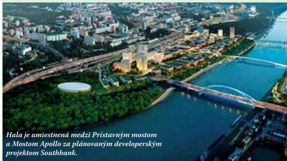
Hala je umiestnená medzi Prístavným mostom a Mostom Apollo za plánovaným developerským projektom Southbank.

Multifunkčnú halu s kapacitou 17 - tisíc divákov v hlavnom meste by chcel postaviť štát v spolupráci so samosprávou. Hovorí o tom Andrej Danko, ktorého SNS má v gescii rezort športu.