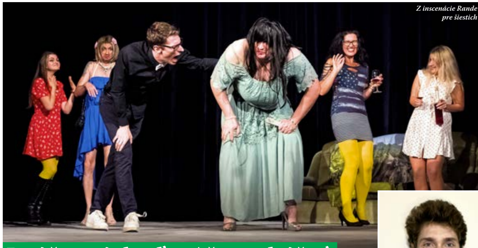
Z inscenácie Rande pre šiestich