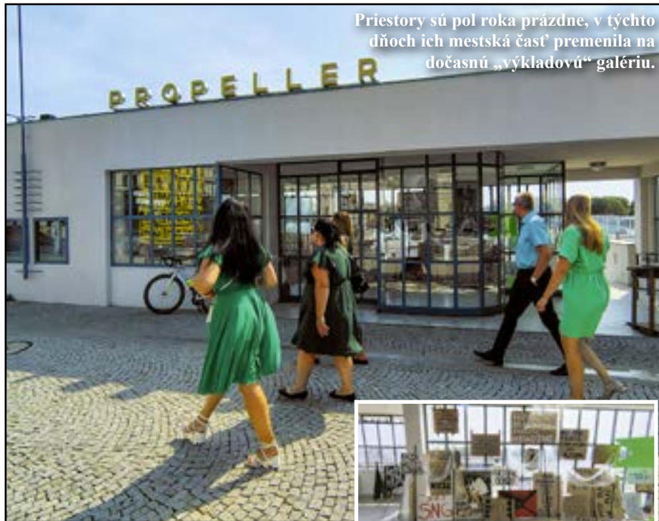
Priestory sú pol roka prázdne, v týchto dňoch ich mestská časť premenila na dočasnú „výkladovú“ galériu.

19 Lietajúci zázrak z Prešporoku Lietanie je prastarý sen ľudstva. Vedeli ste, že najznámejšia vzducholod' Zeppelin má pôvod v našom meste?