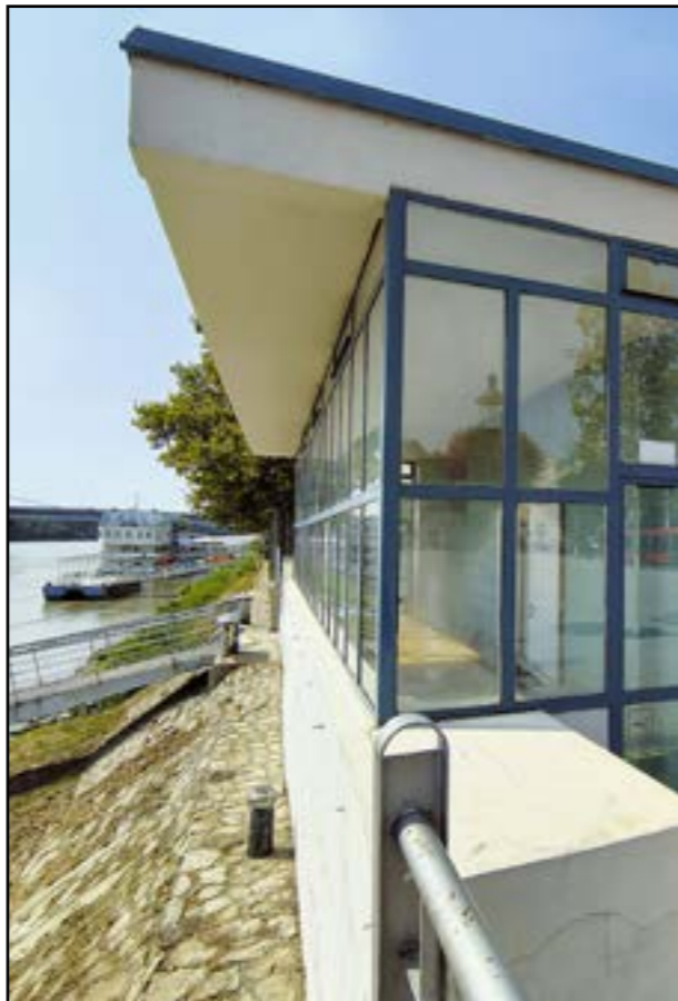
V budove už sídlila neziskovka, kaviareň aj predajňa suvenírov. Mestská časť vyhlásila v minulosti viac súťaží na prenájom Propelleru, ktoré boli neúspešné alebo zrušené.

Samospráva avizuje prepracovať podmienky súťaže s čo najväčším možným dôrazom na kvalitu náplne budovy Propelleru. Inšpirovať sa chce súťažou, ktorú mesto vyhlásilo na prenájom priestoru súčasného Bistra Ferdinand v Sade Janka Kráľa, kde ponúknutá cena za nájom tvorila menšiu časť hodnotenia. Najviac zavážili referencie a história súťažiaci