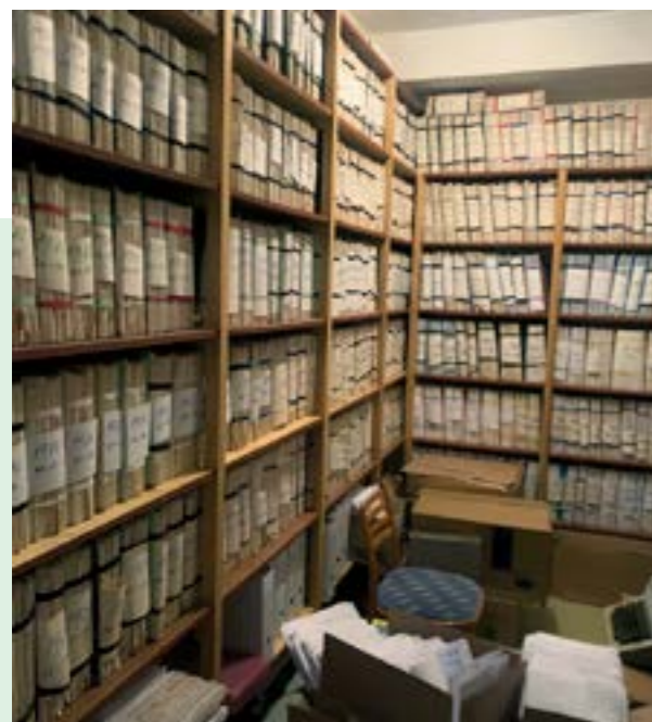
▲ Archív zariadenia, ktorý ukrýva ešte karty pacientov predchádzajúceho sanatória.

Pre Petržalčanov bolo výhodné, že mali do zariadenia blízko, ale navštevujú ho aj ľudia z iných miest.