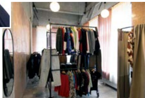
▲ Toto oblečenie však musíte vedieť nosiť, dokázať ho dobre skombinovať a potom sa ukáže jeho výnimočnosť.

„Vintage móda je taká populárna aj preto, že v minulosti sa vyrábalo podstatne kvalitnejšie oblečenie ako