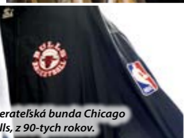
Zberateľská bunda Chicago bulls, z 90-tych rokov.