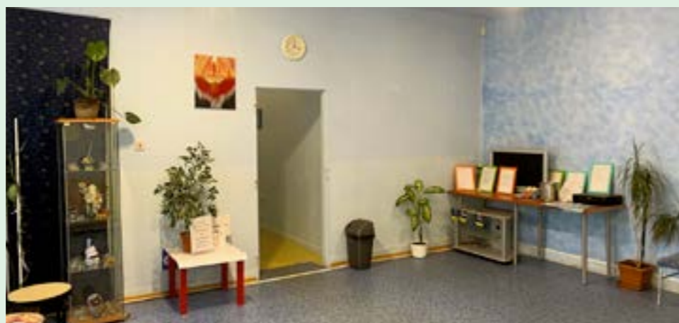
▲ Vstupná hala, v ktorej okrem prác pacientov nájdete aj upozornenia, že v tomto zariadení treba odložiť mobilné telefóny.