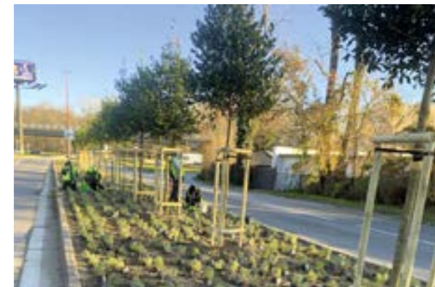
▲ Stromy a levandule na Kutlíkovej