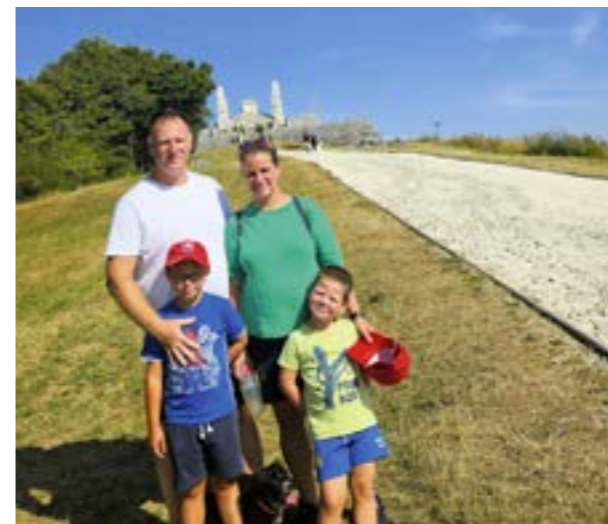
▲ „Oproti mladým dievčatám, ktoré nemajú deti, mám výhodu, že sa mám vždy kam vrátiť a moje deti aj manžel sa na mňa tešia. Či som prvá alebo posledná,“ hovorí streľkyňa.

Nie sú rodinné povinnosti nevhodou oproti konkurentkám, ktoré podobné starosti nemajú?