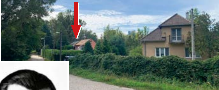
▲ Slovenská ľudová škola v Ovsišti bola umiestnená v budove označenej šípku, ktorá sa nachádza na dnešnej Klokočovej ulici.