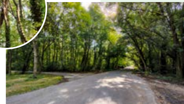
▲ Topole šlachtence sú roztrúsené po celých lužných lesoch. Na území za Malým Draždiakom smerom k BVS (vpravo vidno lesnú cestu smerom na Antolskú, kde je otočisko autobusov), však tvoria ucelenú plochu. Nielenže sú to nepôvodné druhy, ale už sú aj staré. Dozrievajú a padajú.