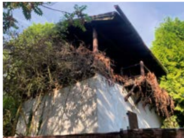
▲ Jagdhaus zo zadnej strany. Odtiaľto vidno, v akom zlom stave je.

Hovorím mu, že jediný, čo ma ruší, je ten hnusný plechový plot. Hoci ho dobrovoľníci očistili a natreli. „V projekte