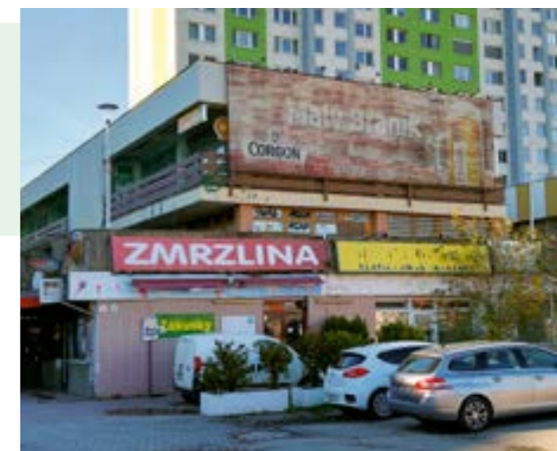
▲ Prvým krokom bude sanácia. Nevyhnutná bude oprava strechy, kontrola statiky či vypratanie a uzatvorenie priestorov.