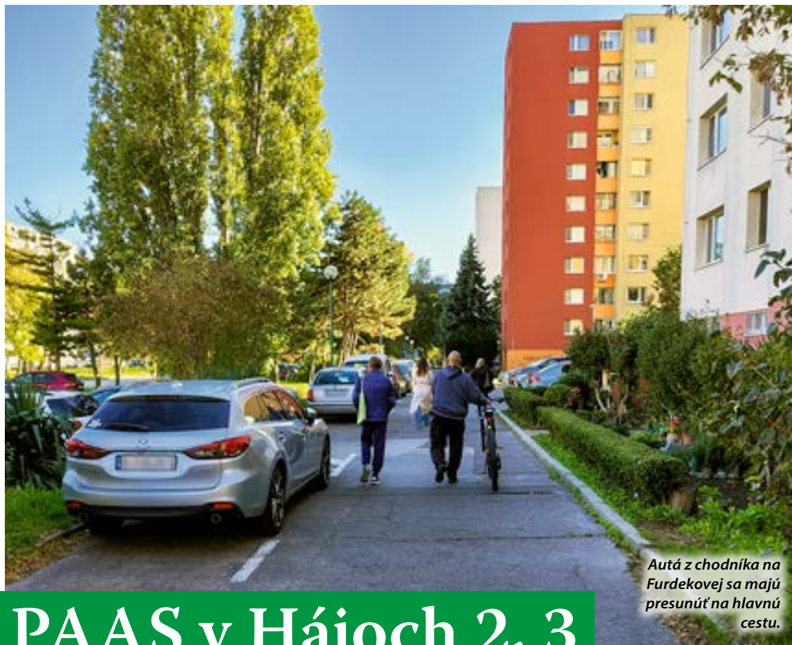
Autá z chodníka na Furdekovej sa majú presunúť na hlavnú cestu.