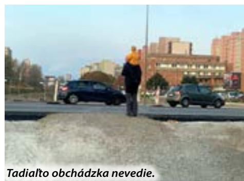
Tadiaľto obchádzka nevedie.

Najskôr bol vjazd na Wolkovu uzatvorený, potom ho povolili, lebo obyvatelia sa nemali ako dostať domov. Vjazd aj výjazd z Rusovskej cesty na Jungmannovu ulicu (ktorá je aktuálne obojsmerná) je síce zatvorený, ale počas našej návštevy sme do nej videli vchádzať minimálne dve autá.