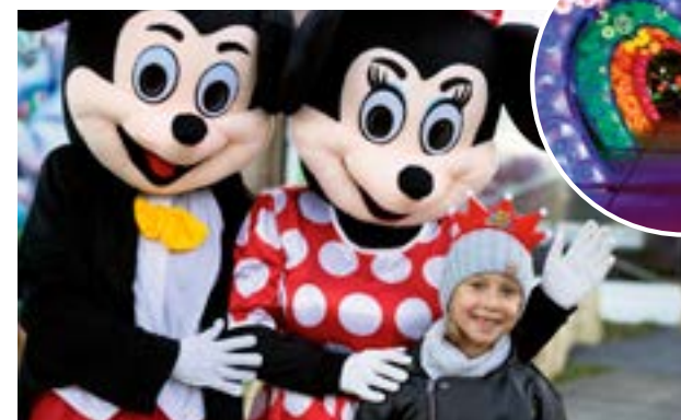
▲ Deti sa môžu odfotiť s postavami, ktoré poznajú z rozprávok.