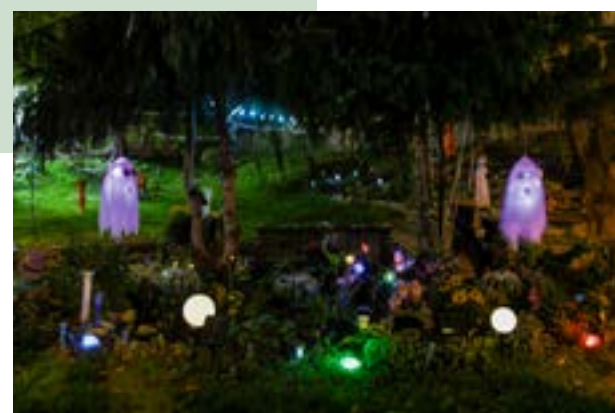
▲ Halloweenskú tému onedlho vystrieda vianočná.