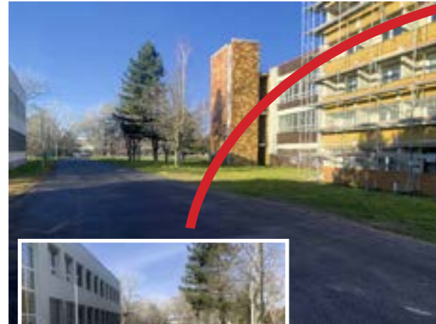
Nový chodník používajú nielen chodci a cyklisti, ale aj autá.