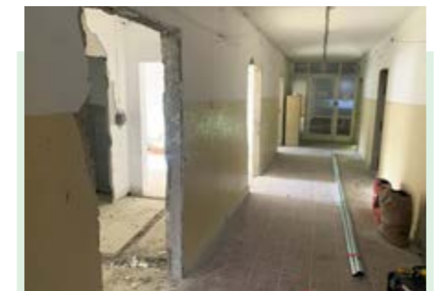
▲ Obnovené garžónky sú určené pre učiteľov, zdravotníkov alebo matky s deťmi v núdzi. Ich rekonštrukciu financuje mestská časť zo svojho rozpočtu.