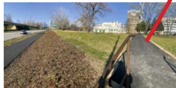
▲ Chodník od Starej školy (dnes materská škola pri Ekonomickej univerzite) k Dolnozemskej ceste

„Žijem pri Ekonomickej univerzite a nerozumiem, prečo sme robili Dolnozemsú od zastávky Prístavnému mostu. Ja tam veľký pohyb občanov Petržalky nevidím. Ale zaujíma ma skôr areál EU, prečo bola mestskou časťou urobená privádzacia cesta od Májovej ulice k EU, ktorá je podľa mňa v areáli univerzity? Aký k nej máme vlastnícky vzťah? Ďalšia cesta od starej školy k uzatvoreniu podchodu na Dolnozemskej. Je tam nádherná 4-metrová asfaltová cesta, ktorá nikam nevedie. Tomu tiež nerozumiem. Kto z obča-