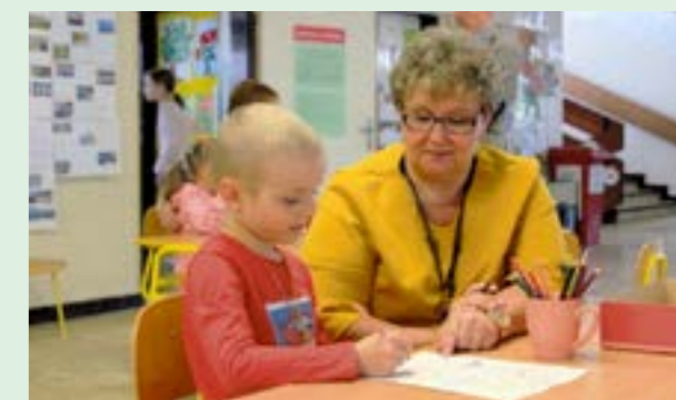
farby, drží správne ceruzku. Pri zápise je aj odborný tím, ktorý v prípade potreby odporučí rodičom, aby od

apríla do septembra ešte navštívili logopedičku alebo absolvovali psychologické vyšetrenie.“