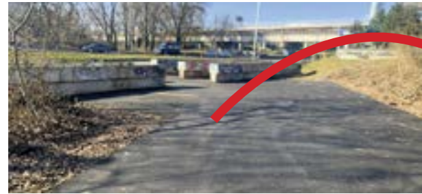
▲ Chodník od uzavretého pešieho podchodu popod Dolnozemsú cestu pri privádzaci k Prístavnému mostu po Starú školu (dnes materská škola pri Ekonomickej univerzite)