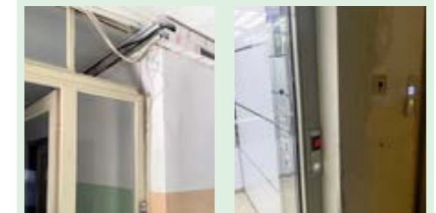
▲ Káble natiahnuté cez sklenú výplň dveri