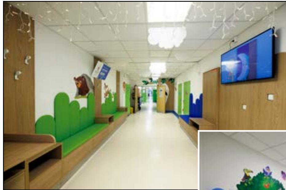
Nemocničné prostredie vplýva na psychiku detí aj rodičov.

NOVÉ MESTO Nezisková organizácia Ronald McDonald House Charities (RMHC) dokončila ďalší projekt zameraný na zlepšenie nemocničného prostredia pre malých pacientov. Tentoraz prešlo kompletnou modernizáciou oddelenie dojčiat na Klinike detskej chirurgie v Národnom ústave detských chorôb.