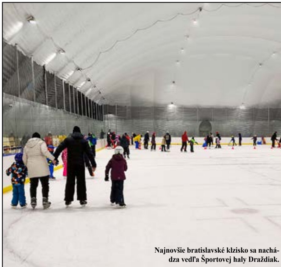
Najnovšie bratislavské klzisko sa nachádza vedľa Športovej haly Draždiak.

Vedeli ste, že obytnú štvrť na Kramároch nám pomohli postaviť košičkí stavbári? Z východu vozili dokonca vlastné panely.