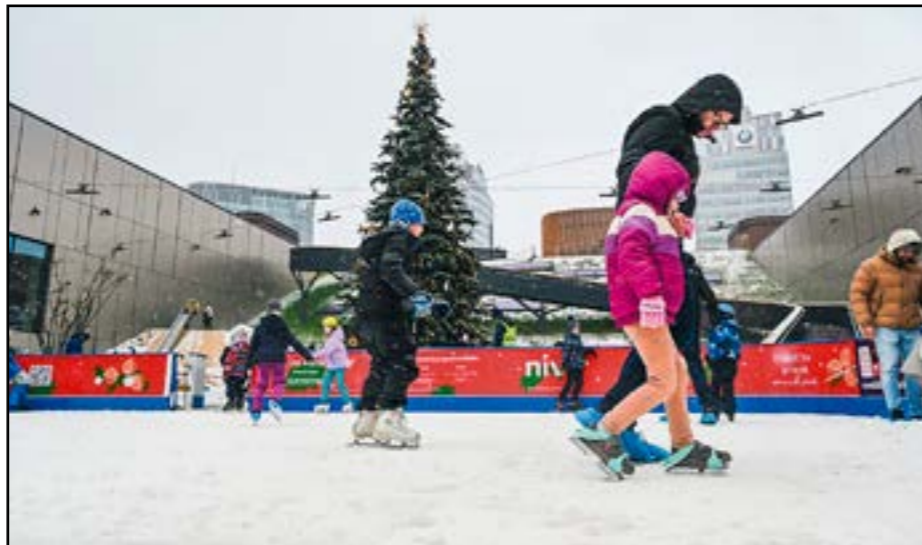
Nivy centrum

Z nákupných centier ponúka tento rok vonkajšie klzisko len Nivy centrum.