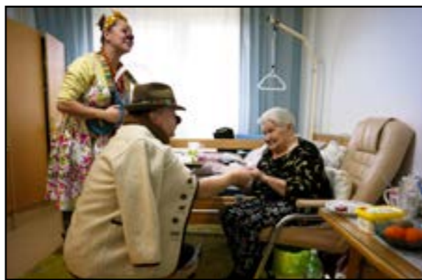
Obyvatelia seniorských zariadení sa v minulom roku tešili z klaunských návštev 250-krát.

emocionálny zážitok, a zároveň ich motivovať k duševnej a fyzickej aktivite, vrátane práce s pamäťou,“ vysvetľujú klauni. Hlavným zdrojom financovania ich aktivít sú príspevky od individuálnych darcov, ktoré v minulom roku predstavovali až vyše