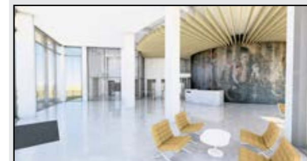
V budove má byť vstupné foyer, ale aj kaviareň či jedáleň.

nosti ministerstvo obrany sídli o pár desiatok metrov ďalej v komplexe budov v areáli Kutuzovových kasární. Rekonštrukcia budovy je však len na začiatku a ministerstvo už eviduje problémy, adekvátne k veku a typu konštrukcie budovy. Odhadovaný rozpočet z roku 2022 tiež museli značne navýšiť. Rozpočet sa z 34,8 milióna eur vyšplhal až na 58 miliónov eur, čo však ešte nemusí byť finálna suma, nakoľko rekonštrukciu dokončia až budúci rok. „Financovaná bude z vlastných zdrojov a plánu obnovy,“ dodal Bachratý. Dobrou správou je, že budova si aj po rozsiahlej rekonštrukcii zachová svoj ikonický vzhľad. Cieľom rezortu je totiž zabezpečiť komplexnú revitalizáciu objektu pri zachovaní jeho architektonickej a historickej hodnoty a vytvorenie moderného a funkčného komplexu pre potreby nového sídla. (bn)