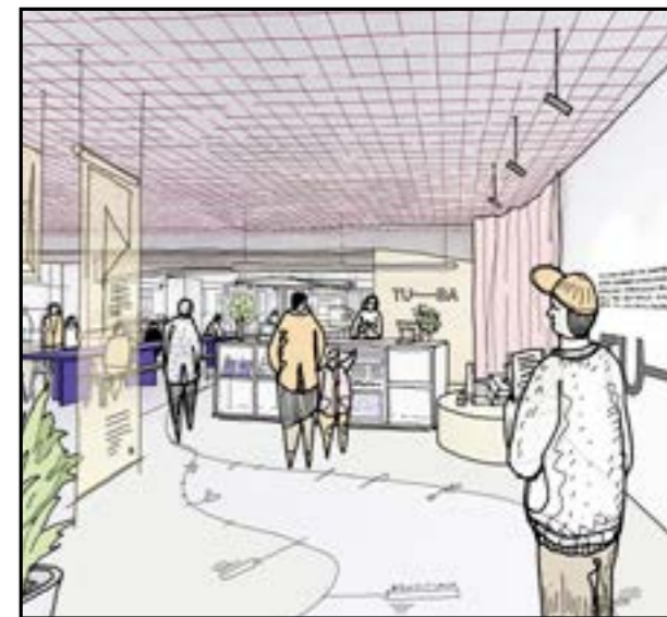
V TU-BA budú vítaní všetci, ktorí sa podieľajú a zaujímajú o mesto, jeho plánovanie a tvorbu.