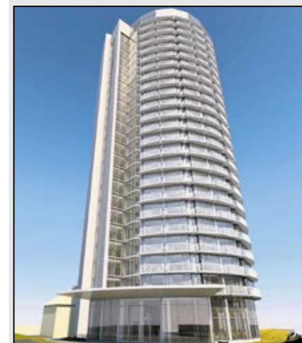
S 82 metrami patrila Kukurica v čase svojho vzniku k najvyšším budovám v meste.