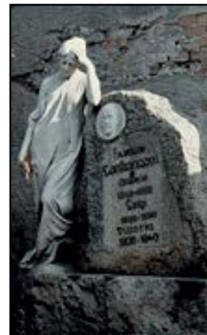
Pomník rodiny slávneho staviteľa na Ondrejskom cintoríne