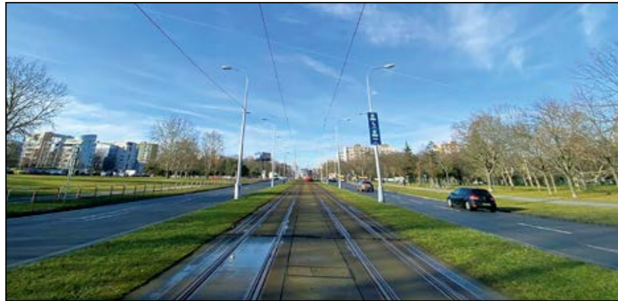
Ružinovská radiála je tretou zo štyroch električkových radiál, rekonštruovaných za súčasného vedenia mesta.