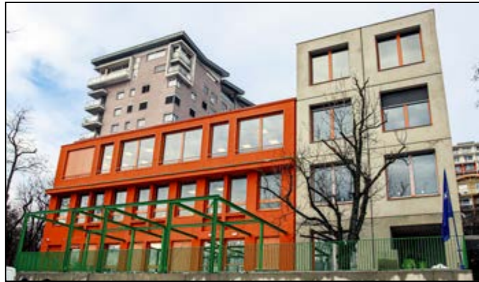
Podporu kraja získala aj ZČ Cádrová, kde nedávno pribudol nový pavilón.

„Po úspešných projektoch realizovaných s podporou Integrovaného regionálneho operačného programu v rokoch 2022 a 2023, ktorých cieľom bolo zvýšenie kapacity základných škôl v kraji, sme tentokrát cielili na podporu zlepšenia kvality vzdelávacieho procesu a jeho priestorových podmienok,“ doplnil. Podporené projekty sa zameriavajú na budovanie odborných učební a ich vybavenie, budovanie a roz-