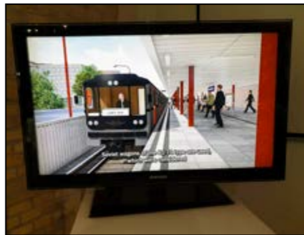
V Bratislave sa počítalo s metrom sovietskeho typu.

žalkou až na jej koniec na Janíkovom dvore.“ S tou sa počítalo už v čase výstavby sídliska, kde vynechali pás, aby sa nemuseli tunely raziť, ale aby sa mohli kopať z povrchu. Dočasná, povrchová trasa metra, označená ako „I. stavba“, mala mať tri stanice (Mlynské nivy, Martanovičova a Petržalka Centrum), merať 2,6 kilometra a spreádzkovaná mala byť v roku 1987. Po realizácii oboch