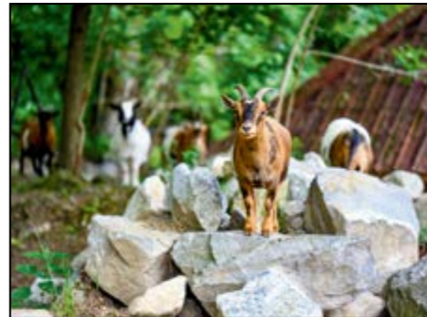
K najobľúbenejším novinkám patrí Gazdovský dvor.