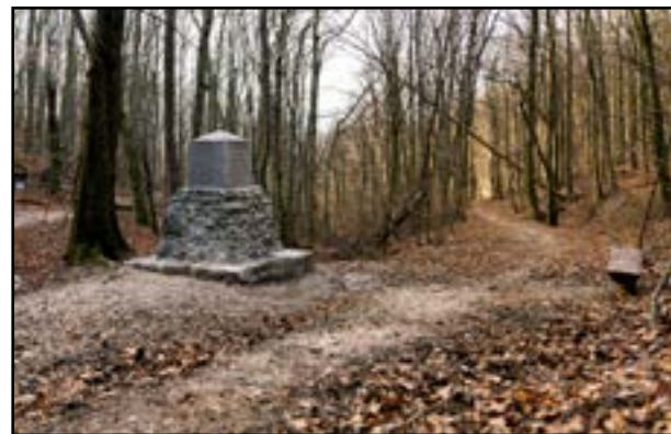
Pamätník sa nachádza na žltej turistickej trase neďaleko hotela West.