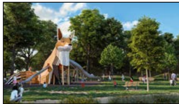
Hracia líška nahradí dve súčasné menšie detské ihriská, ktoré Mestské lesy presunú do svojho nového areálu v petržalskej Hájovni.

jekt rozšírenia prírodného Šantiska na Kamzíku, ktorý sa teší veľkej obľube nielen u turistov či cyklistov, ale je tiež častým cieľom rodín s deťmi. V jednej z najnavštevovanejších lokalít v lesoparku pribudne nový mobiliár, ale aj atraktívne prvky pre rôzne vekové skupiny. V pláne je agility dráha, lezecké siete, zip-line, rôzne typy kladín, hojdačky, rotačné prvky, tu-