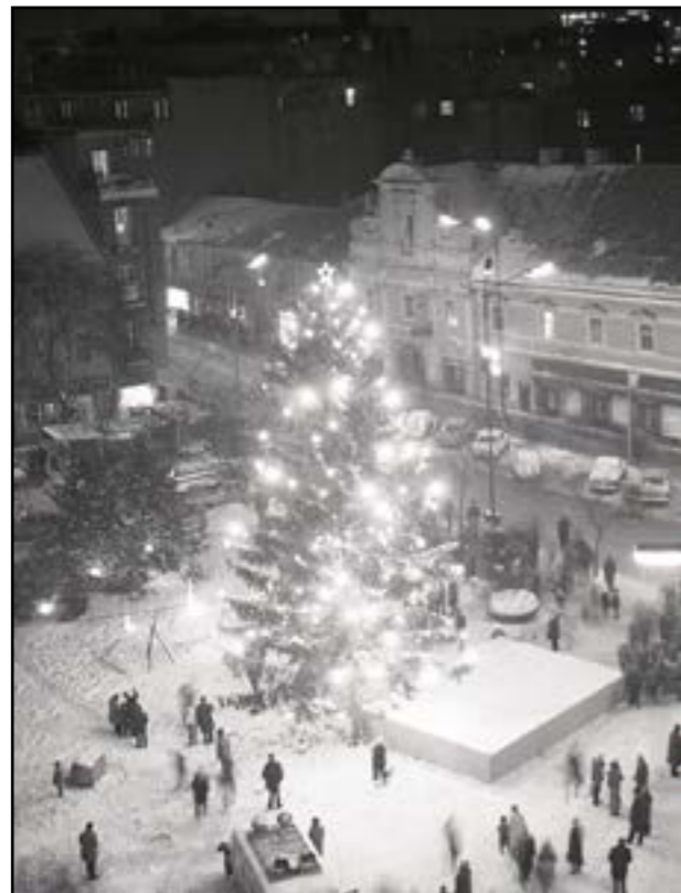
Takýto vianočný strom zdobil Námestie SNP v roku 1969.

Myšlienka vianočného stromu „všetci všetkým“ vznikla počas 1. svetovej vojny v Kodani. Mesto chcelo ukázať, že láska k ľuďom nezanikla ani v najťažších časoch, a na námestí preto každoročne vztýčovali vysoký smrek ozdobený stovkami svetiel, pri ktorom sa zbierali dary pre chudobné a opustené deti. Na túto myšlienku sa v roku 1925 rozhodla nadviazať aj Bratislava. Členovia miestneho spolku Československého Červeného kríža zvolali na