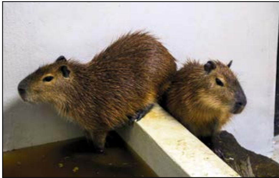
Návštevníci roztomilé kapybary uvidia až na jar.

z tropických oblastí Južnej Ameriky, kde je celoročne teplo a na zimu nie sú adaptované. Ich srst je prispôbená rýchlemu schnutiu, nie udržiavaniu telesného tepla, a tak by im chladné počasie mohlo veľmi rýchlo uškodiť. Zatiaľ preto zostávajú vo vyhrievanom vnútornom zázemí s bazénom a postupne si zvy-