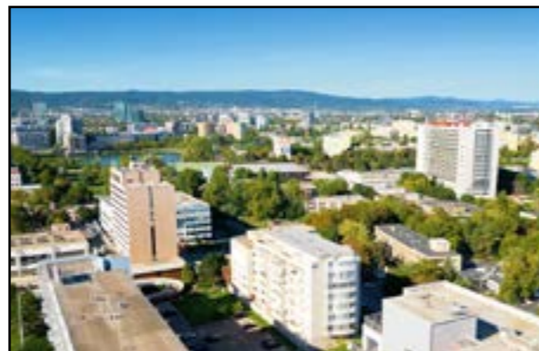
DNES: Rovnaký záber na sídlisko Štrkovec o 52 rokov neskôr

S výstavbou Štrkovca sa začalo v roku 1961, na budúci