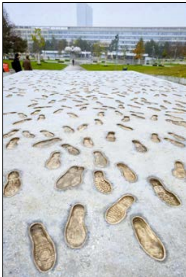
Stopy symbolizujú silu ľudí, ktorí sa spojili a dokázali zvrhnúť totalitný režim.