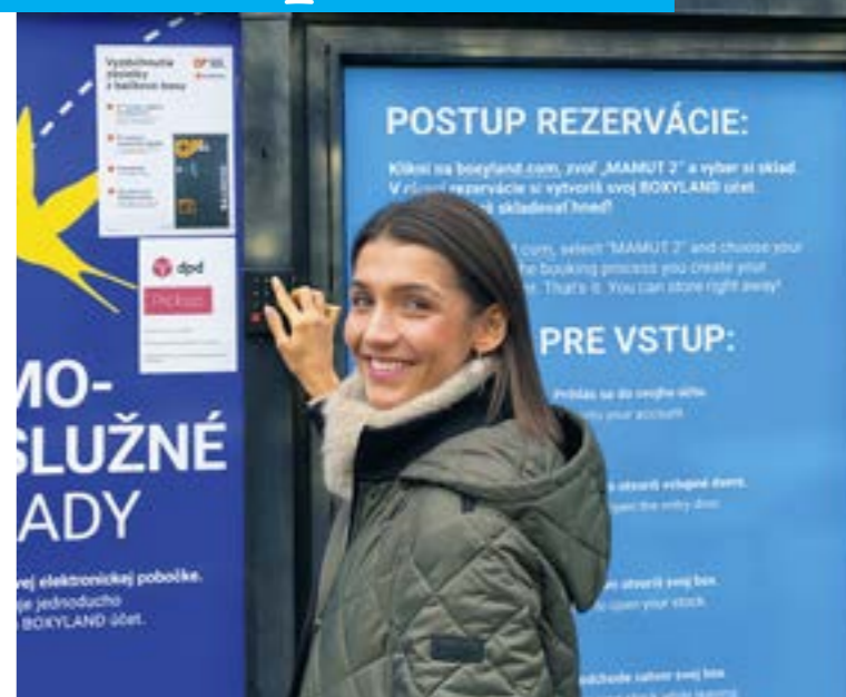
Dovnútra sa dostanete vďaka prístupovým údajom, ktoré vám prídu do aplikácie v telefóne.

My sme otestovali box na Cintorinskej ulici v Starom Meste v budove Mamuta. Prebehlo to naozaj jednoducho. V telefóne sme si našli kód, ktorým sme si odomkli vhodové dvere do budovy. Následne sme sa ocitli na chodbách, kde sa nachádzali boxy rôznych veľkostí. Od malých do dvoch metrov štvorcových, ktoré si môžete prenajať na mesiac za desiatky eur, až po najväčší s plochou vyše