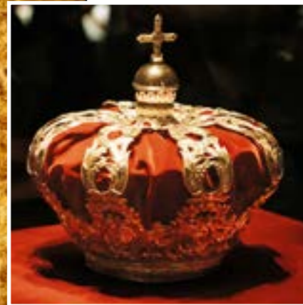
Španielsky kráľ Alfonz XIII. dal korunu do záložne, aby mohol mňať na zábavy.

zábavy. Zhýralý život veľčenstva však hostiteľov stál priveľa peňazí, začali uzdu jeho nespútanosti utáhoval, obmedzili mu aj štedrú aparážu. Alfonz s osobným tavidolom a malým kruhom poradcov sa začali radiť, ako zo situácie bez hanby a straty etí vybrnúť, keď už v batohoch veľa šperkov nezostalo. A tak sa jedného dňa tajomník vydal spod Tatier na dlhú cestu do Prešporka, do miestnej záložne. Pred ním tam prišiel posol s listom. Predstavenstvo záložne už pána tajomníka čakalo.