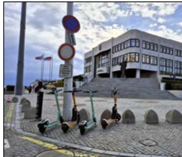
Pôvodným cieľom novely bolo zvýšenie ochrany chodcov pred elektrickými kolobežkami, no ovplyvní aj deti na bicykloch či korčuľiach.