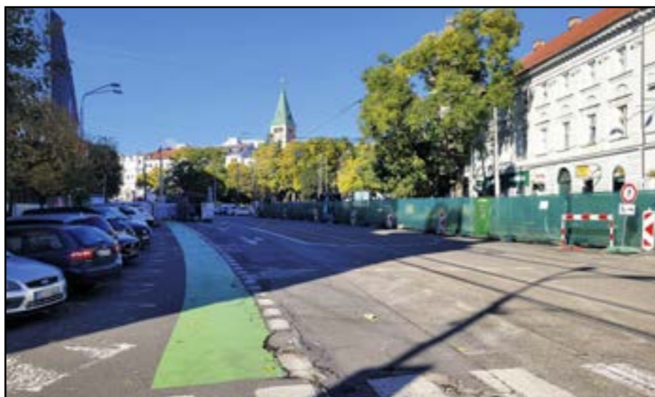
Budúcoročný rozpočet mesta počíta aj s rekonštrukciou Námestia SNP.

Vyšší rozpočet (11,1 milióna eur) je plánovaný aj na opravu a údržbu ciest a chodníkov a zásadne sa tiež navyšujú financie na výstavbu a údržbu parkovacej infraštruktúry. O viac ako 8,5 milióna eur v porovnaní s rokom 2025 pôjde aj na skvalitňovanie verejnej dopravy, vďaka čomu bude môcť Dopravný podnik kúpiť ďalšie nové vozidlá, a významnú položku v rozpočte tvoria tiež investície do dopravnej infraštruktúry a verejného priestoru (modernizácia Ružinovskej radiály, výstavba trolejbusovej trate medzi Patrónkou a Rivieťou a Bulharskej – Galvaniho). Najväčšiu položku spomedzi verejných priestorov tvorí rekonštrukcia Námestia SNP a Námestia Nežnej revolúcie. V sociálnej oblasti možno spomenúť navýšenie investícií do plánovaných opráv a rekonštrukcií pobytových zariadení pre seniorov. Najľudnatejšia mestská časť PETRŽALKA bude v roku 2026 hospodáriť so sumou viac než 131 miliónov eur. Najväčšiu časť bežných výdavkov „zhltnú“ vzdelávanie (viac ako 45 miliónov eur), nasledované prevádzkou miestneho úradu, sociálnou pomocou, kultúrou a športom. Kapitálové výdavky v celkovej výške takmer