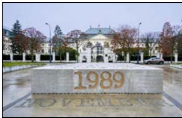
Pamätník novembra 1989 je umiestnený neďaleko Úradu vlády.