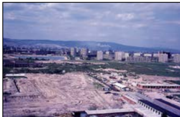
ROK 1973: V tomto čase už na Štrkovi premávala aj električka.