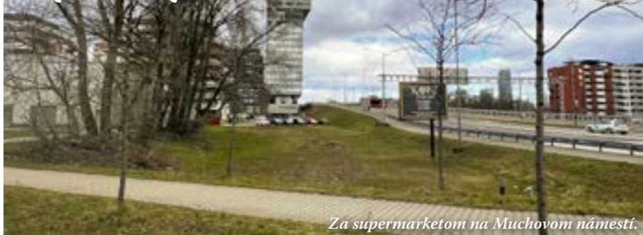
Za supermarketom na Muchovom námestí.

Územnoplánovacia štúdia zóny Petržalka – Muchovo námestie navrhuje aj bytový dom rovnou za supermarketom. Prečo je Petržalka proti?