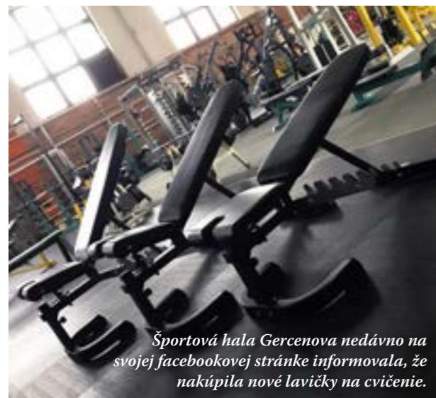
Športová hala Gercenova nedávno na svojej facebookovej stránke informovala, že nakúpila nové lavičky na cvičenie.

▲ Kompletne zrekonštruovaná ŠH Prokofievova je podľa samosprávy zisková napriek tomu, že tam bezplatne športujú deti z materských a základných škôl aj seniory.