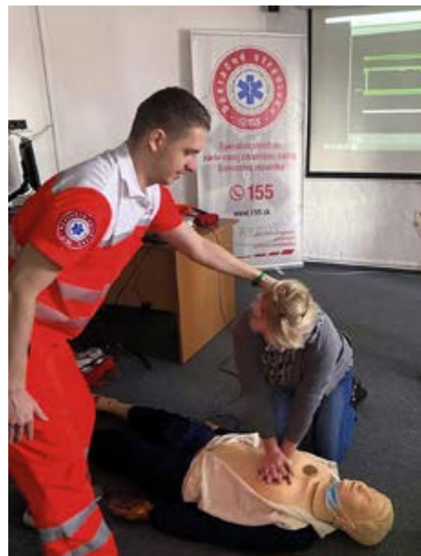
▲ Opatrovateľky absolvujú aj kurz prvej pomoci.