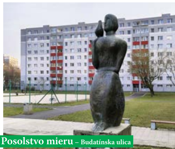
Posolstvo mieru – Budatínska ulica