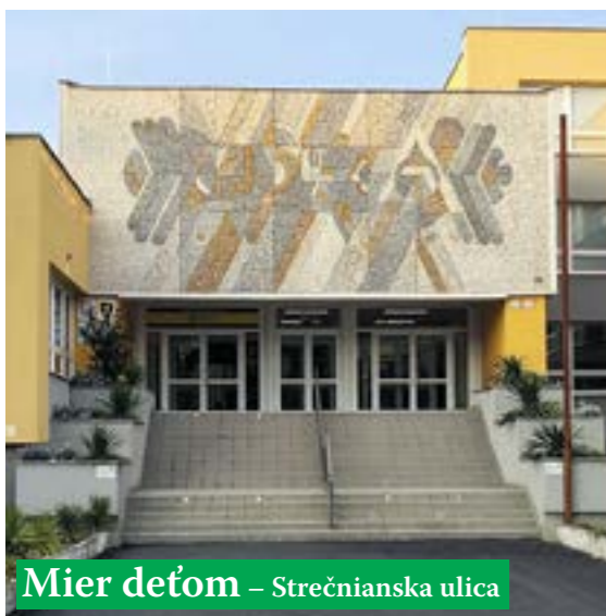
Mier deťom – Strečnianska ulica