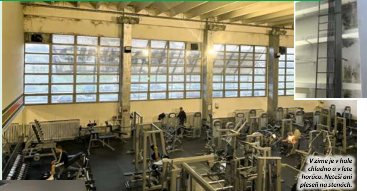
V zime je v hale chladno a v lete horúco. Neteší ani pleseň na stenách.