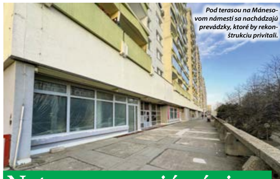
Pod terasou na Mánesovom námestí sa nachádzajú prevádzky, ktoré by rekonštrukciu privítali.