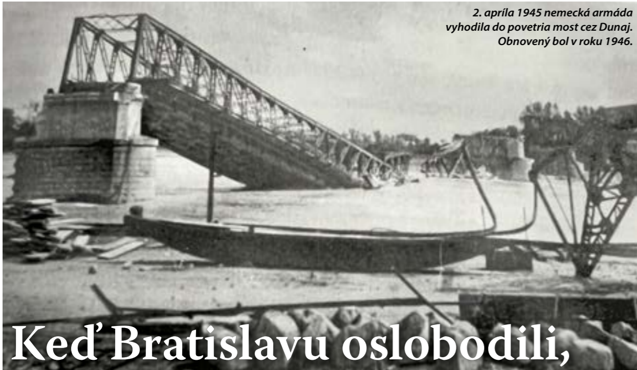
2. apríla 1945 nemecká armáda vyhodila do povetria most cez Dunaj. Obnovený bol v roku 1946.