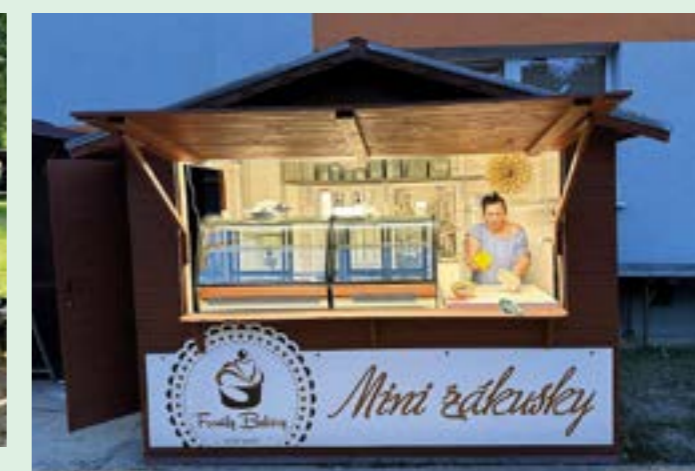
▲ Stánok na stupavskom trhu majú dodnes.