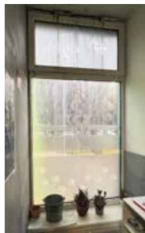
Zničené okno veterinárnej kliniky EasyVet a neodmysliteľné vedro.

Bytový podnik Petržalka to chcel zmeniť a využiť na to schválený dotačný program na rekonštrukciu pochôdznych terás. Vlastníkom bytov a nebytových priestorov dokonca ponúkol, že sa o celý proces administratívy postará. Hlavné mesto poskytuje v rámci programu dotáciu vo výške 50 % oprávnených nákladov maximálne do výšky: 15 000 eur na posudky, 20 000 eur na projektovú dokumentáciu a 75 000 eur na stavebné