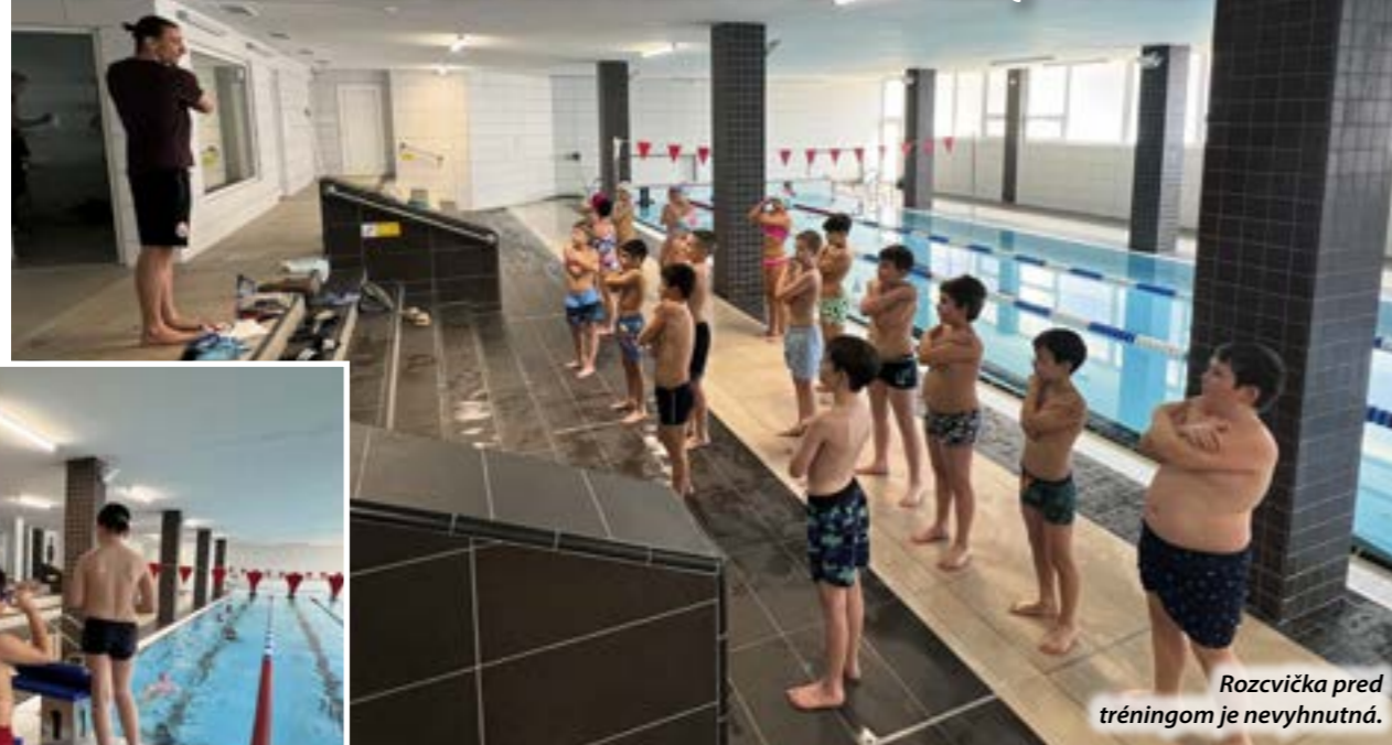
Rozcvička pred tréningom je nevyhnutná.

◀ Keď prichádzajú na kurz, tak 80 percent z nich nevie preplávať 25 metrov. A keď odchádzajú, tak 80 percent to už vie.