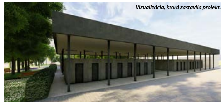
Vizualizácia, ktorá zastavila projekt.

Aj mesto má v Petržalke podobný projekt. Architektonická súťaž na štyri lávky cez Chorvátske rameno bola vyhlásená v marci 2021, výsledky boli známe na jeseň 2022 a priniesli nádherné vizualizácie víťazných lávok. Náklady na realizáciu odhadol MiB na 2,5 milióna eur. Dnes sú z dôvodu nedostatku mestských financií odložené na neurčito, takže aktuálne mestská časť pripravuje aspoň opravu tých dočasných. (in) vizualizácia: 2T Ateliér