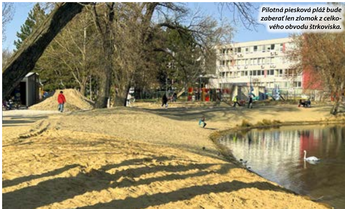
Pilotná piesková pláž bude zaberáť len zlomok z celkového obvodu štrkoviska.