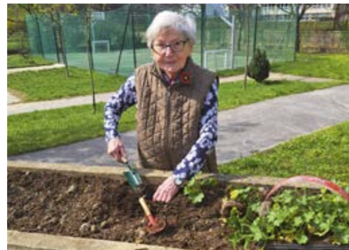
▲ V ZOS na Mlynarovičovej majú denne rôzne aktivity, na jar aj záhradkársku.

„V krízových životných situáciách, keď je život a zdravie človeka vážne ohrozené a poskytovanie sociálnej služby je neodkladné, je mestská časť povinná zabezpečiť sociálne služby bezodkladne,“ informuje Komunitný plán sociálnych služieb mestskej časti Bratislava-Petržalka na roky 2025 – 2030. Okrem iného sa v ňom píše, že „v posledných rokoch zaznamenávame nárast prípadov žiadostí o bezodkladné umiestnenie v ZOS. V období 1–3 kvartálu 2022 bol počet žiadostí 61, v rovna-