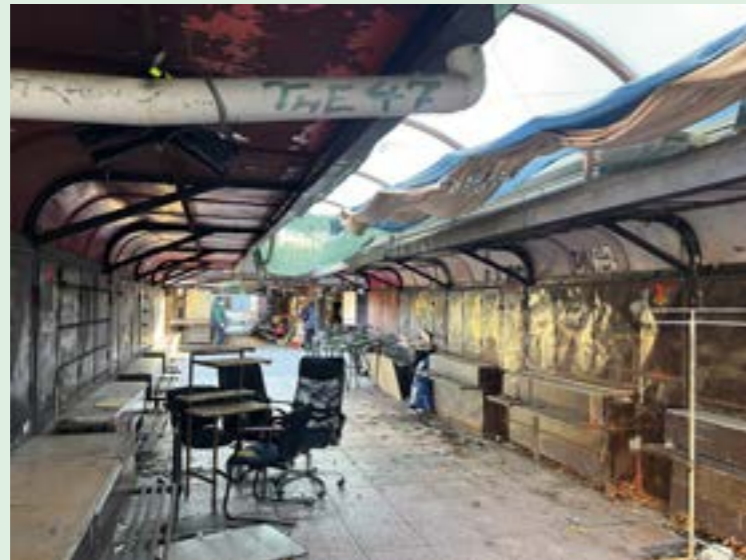
▲ Smutný pohľad, na ktorý sa ťažko hľadajú slová.