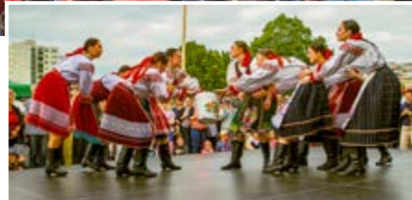
▲ V piatok 1. mája sa môžete tešiť aj na folklór.

„Čakajú vás dva dni plné hudby, tradícií, guláša a zábavy, ktoré vyvrcholia vystúpeniami zvučných zahraničných mien,“ informovala na svojom webe. Piatok 1. máj prinesie folklór, stávanie mája a súťaž vo varení guláša. Sobota 2. máj zas nabitý hudobný program a večer, na ktorý sa oplatí počkať. Mestská časť sľubuje hudobné legendy zo zahraničia z Veľkej Británie a Česka. Vstup je voľný.