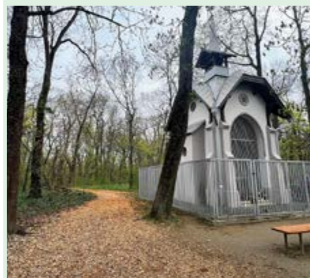
▲ Štiepka na chodníkoch má zvýšiť komfort návštevníkov aj počas daždivého počasia.