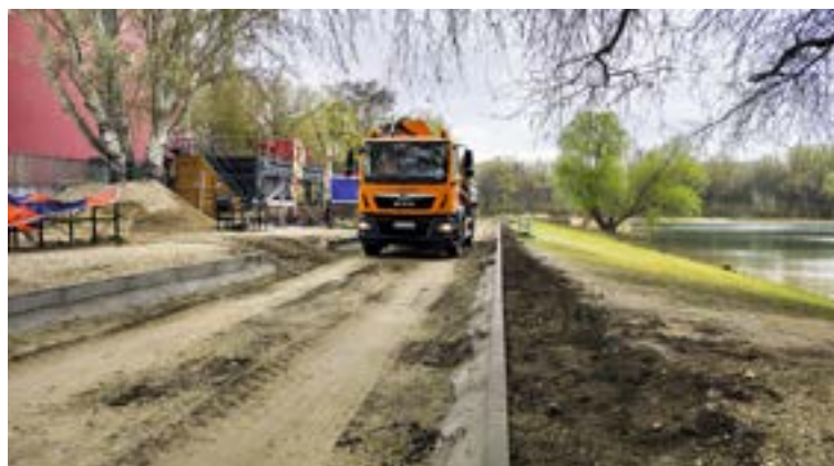
▲ Mlatový chodník povedie od Beach Club Draždiak až po cyklochodník pri Chorvátskom ramene.