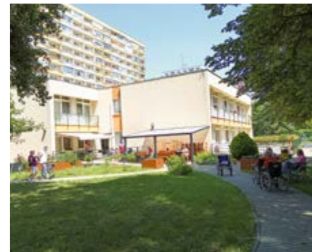
▲ ZOS na Mlynarovičovej je určené pre 30 prijímateľov sociálnej služby.