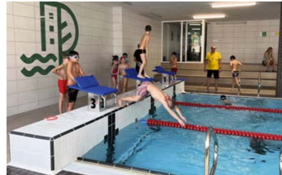
▲ Občas sa vody boja aj deti, ktoré čiastočne vedú zaplávať. A práve prekonanie tohto strachu sa tu majú naučiť. Tréneri im vo vode neasistujú.

Na jedného trénera pripadá 7-8 detí, sú rozdelené v troch dráhach od začiatočníkov až po pokročilých. Sledujem deti skákať do vody, to je bezkonkurenčne najväčšia zábava, niekto len na nohy, niekto aj šípku, bez problémov plávajú na chrbte a viacerí už vedú