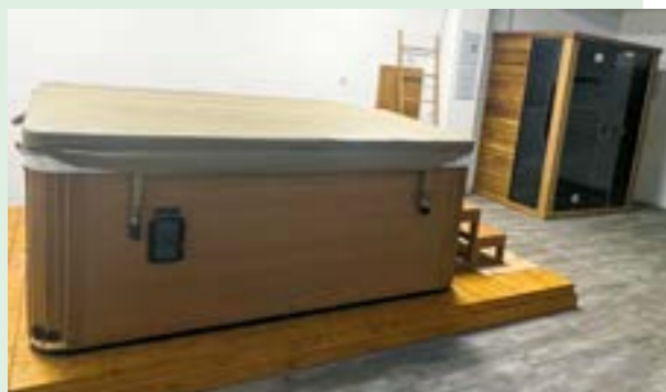
Vírivka a sauna pre profesionálov.