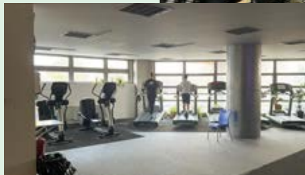
Čiastočne zrekonštruovaná časť haly.