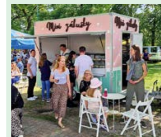
▲ Ich malý prives stretnete aj na akciách, napríklad na Dostihovej dráhe.

V Stupave sa im darilo, postupne mali obchodíky aj pred Tescom v Petržalke, na Miletičke, v Saratove, v Slimáku. Gabrieline deti sa starali o prevádzky a večer chodili pomáhať vyrábať