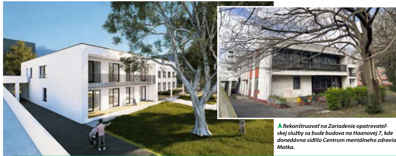
▲ Rekonštruovať na Zariadenie opatrovateľskej služby sa bude budova na Haanovej 7, kde donedávna sídlilo Centrum mentálneho zdravia Matka.