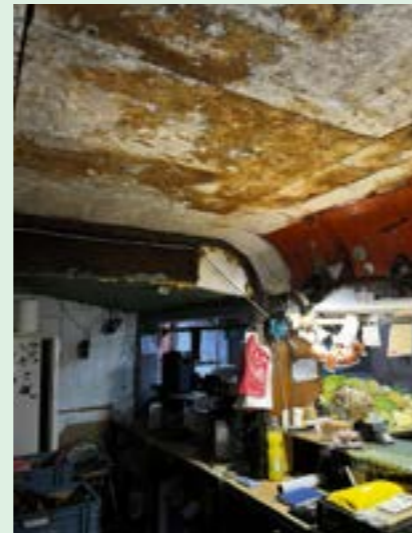
▲ V stánkoch počas dažďov pravidelne skratuje elektrina.