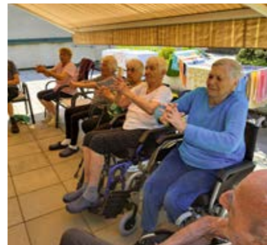
▲ Teplé dni možno tráviť na niekoľkých terasách.