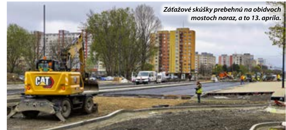
Zaťažovacie skúšky prebehnú na obidvoch mostoch naraz, a to 13. apríla.

Na otázku TASR, či je podľa neho reálne, aby hlavné mesto stihlo podať žiadosť o celkovú kolaudáciu petržalskej trate na jar, podotkol, že to reálne môže byť, ak jar magistrát vníma najširším možným pohľadom, teda na konci ohraničenú dátumom letného slnovratu 21. júna. Podotkol