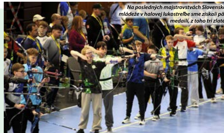
Na posledných majstrovstvách Slovenska mládeže v halovej lukostrelbe sme získali päť medailí, z toho tri zlaté.