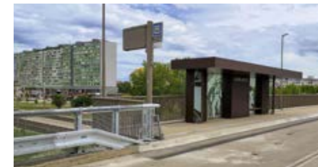
▲ Združená zastávka na Panónskej