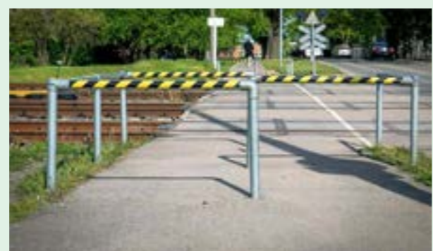
▲ Čelné zábradlie na priechochode cez kolajnice

Bohumil Kováč, architekt a urbanista