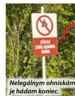
Nelegálnym ohniskám je hádam koniec.