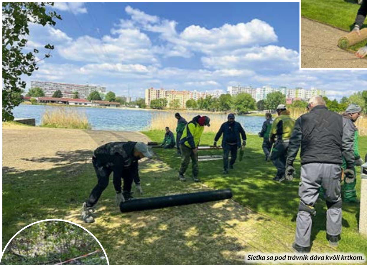
Sietka sa pod trávnik dáva kvôli krtkom.