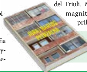
Ilustračná foto je z knihy fotografií Juraja Bartoša s názvom Petržalka, ktorú vydal Konduktor o.z.

Aj Bratislava má svoju seizmickú históriu. V roku 1590 sa po silnom zemetrasení zrútila klenba františkánskeho kostola a poškodená bola aj mestská radnica. Ďalšie otrasy obyvatelia pocítili aj v rokoch 1953, 1977, 1991, 1992 či 2009 a naposledy vo februári 2026. (mč)