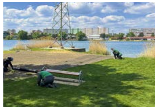
▲ Trávový koberec potrebuje zakoreniť, dajte mu čas.

Hovorím mu, že sa tomu aj ťažko verí, a tak pridá ešte jeden postreh. „Dávali sme nedávno trávnik v lesíku,“