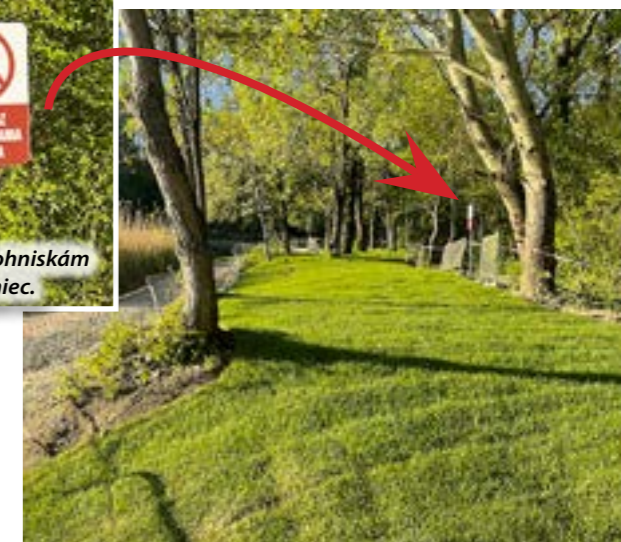
▲ Nový trávnik pod stromami prirodzene nadväzuje na lesný porast.