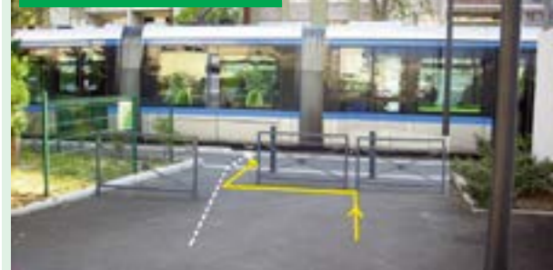
▲ Aj tu by ale zalomenie trasy chodca malo byť také, aby neumožnilo „skratku“ (čiarkovaná čiara).